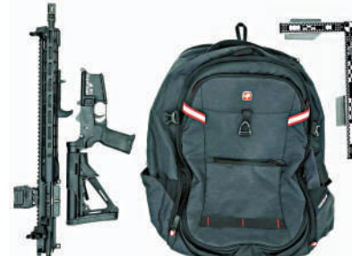
▲FBI發布的照片顯示克魯克斯的步槍和背包。

據介紹，克魯克斯的網絡搜索對象既有民主黨人也有共和黨人，因此難以判斷其行為是否出於政治目的以及最終選擇特朗普作為刺殺對象的原因。