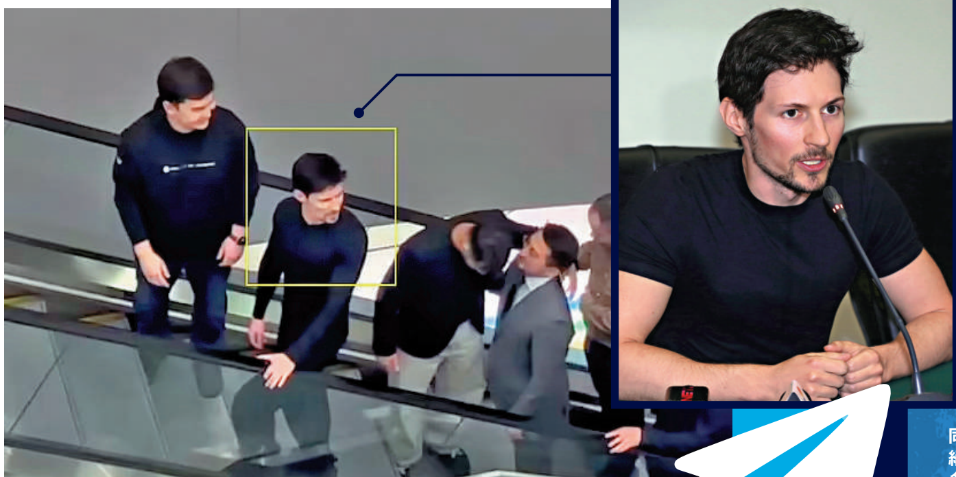
▲杜羅夫24日在法國被捕前幾日，被拍到現身哈薩克斯坦。網絡圖片

【大公報訊】巴黎檢察官貝屈奧在一份新聞公報中表示，杜羅夫已於28日晚被起訴，他在司法監控下獲得保釋，但須繳納500萬歐元的保證金、每周兩次到警察局報到以及被禁止離開法國領土。