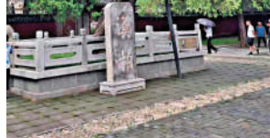
▲岱廟內古木參天，「漢柏」和「唐槐」為古樹名木之最。