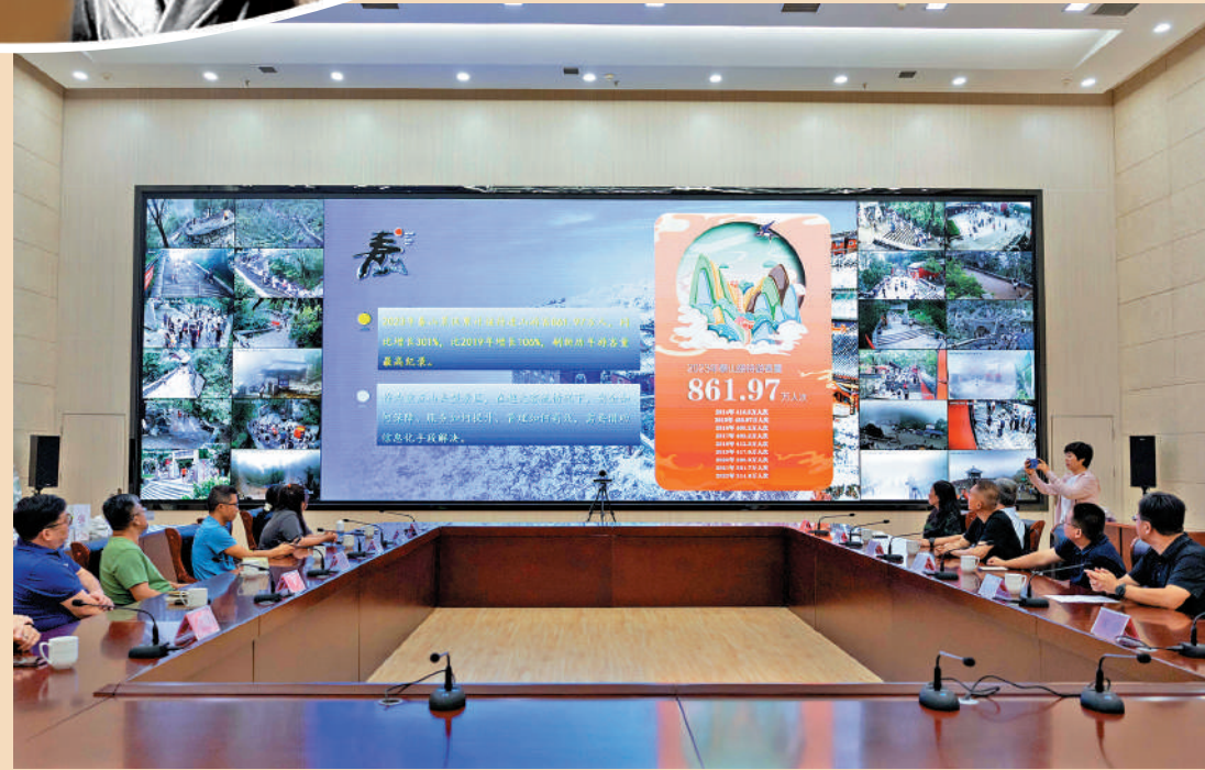
▲智慧泰山管理控制中心實時監測景區的客流量。