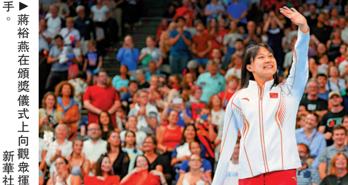
▲蔣裕燕在頒獎儀式上向觀眾揮手。