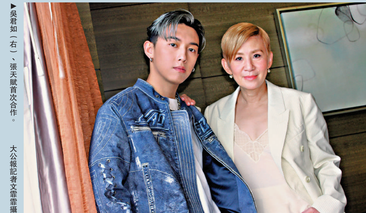
▲吳君如（右）、張天賦首次合作。