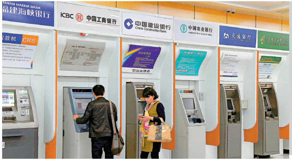
▲A股八金剛之中的四大內銀股，今年股價表現優異。

此外，保險資金也成為了高息股行情的重要推手。在資產配置荒的背景之下，投資者爭相逃離房產與公募，轉而投入保險產品、銀行理財的懷抱，以期