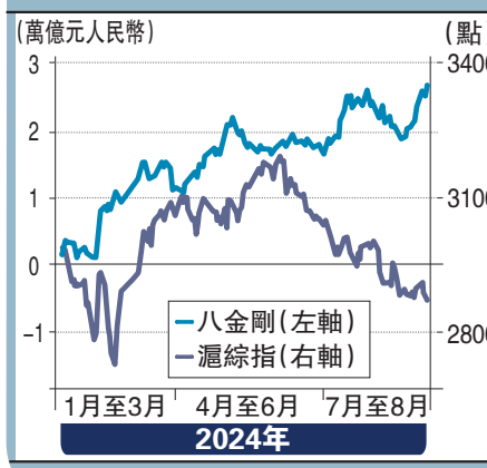
A股八金剛市值變化與滬綜指對比

然而，銀行自身面臨着不小的經營壓力。內地進入減息周期，銀行淨息差大幅縮窄。數據顯示，第二季度商業銀行的淨息差平均為1.54%，顯著低於監管部門設立的警戒線1.8%。其中，大型商業銀行淨息差已經收窄至1.46%。此外，不少農商行為了增加非息收入，轉