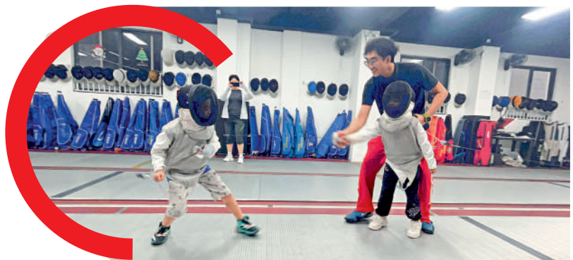
小學員感受劍擊運動的樂趣。