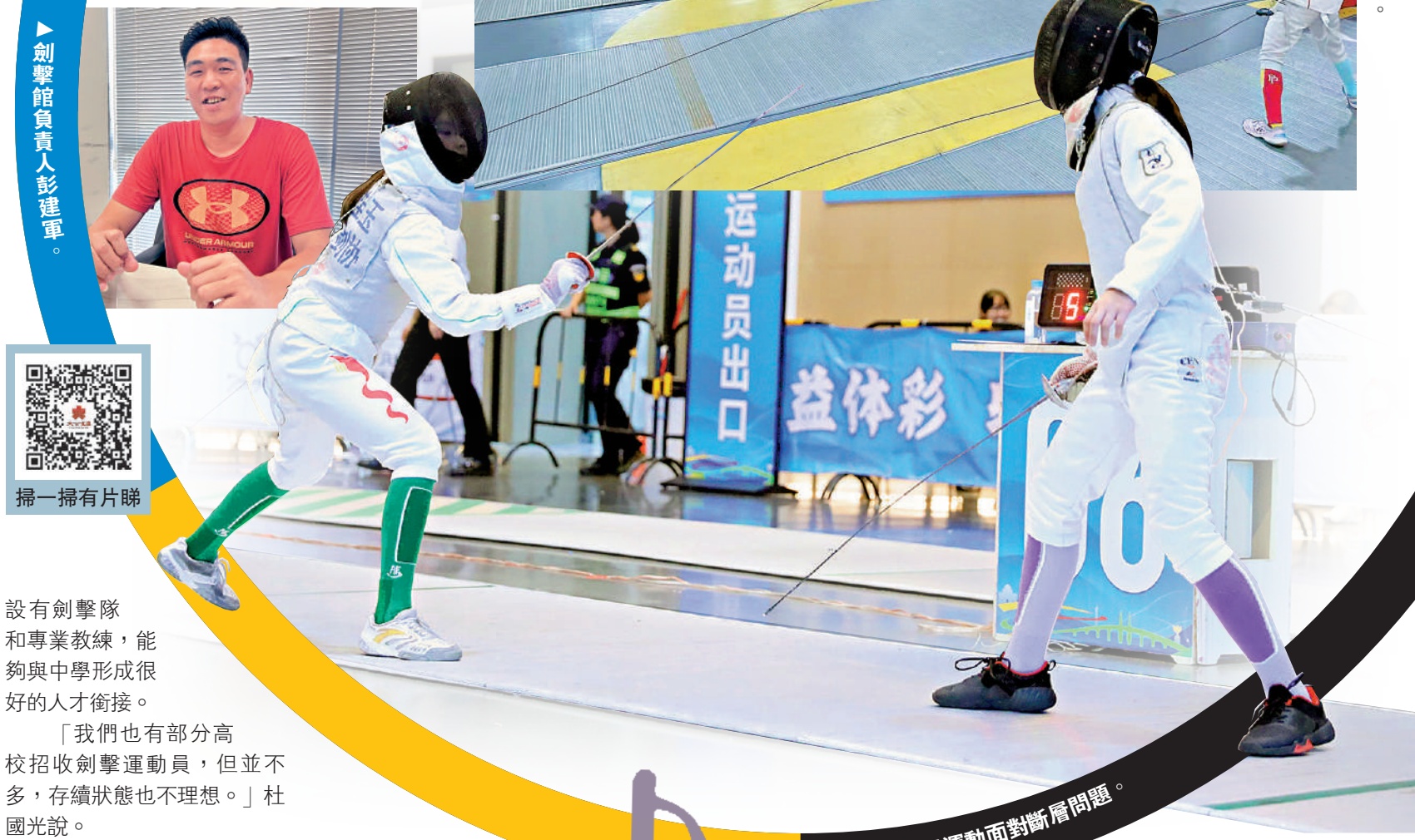
中國劍擊運動面對斷層問題。