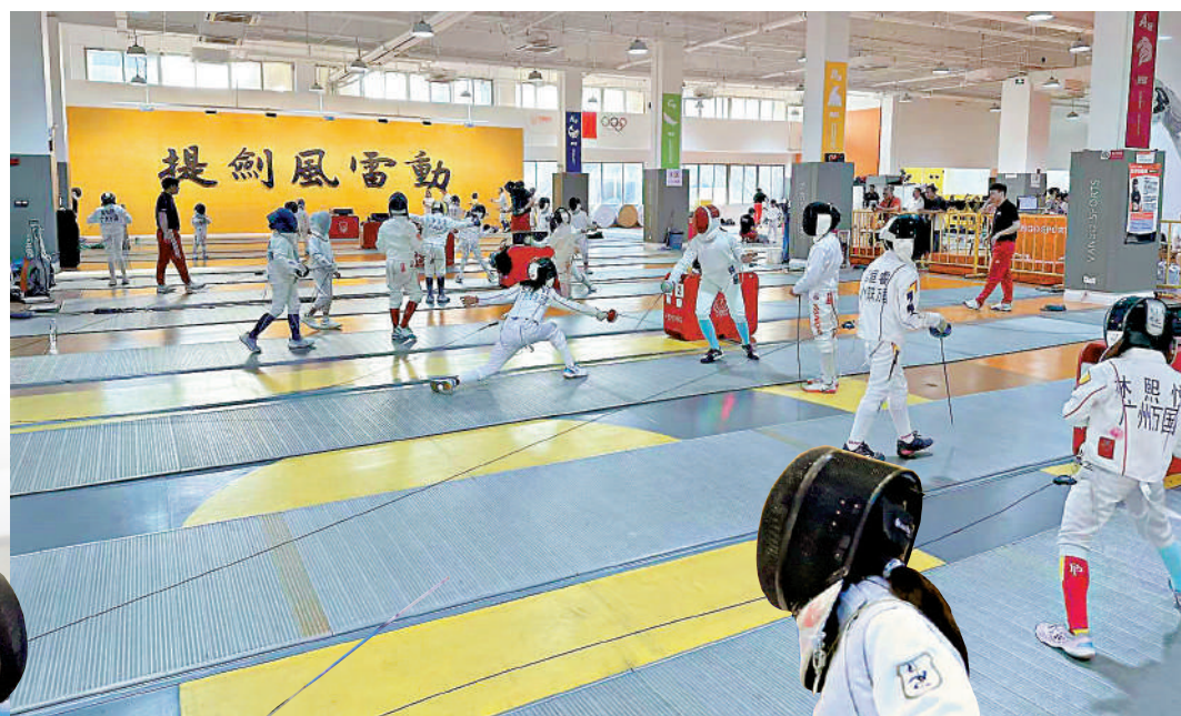
中國12歲以下年齡組劍擊人口龐大。

不過，部分地區也開始探索，統籌推動體教融合，讓競技體育回歸到校園。目前，深圳、上海、北京等地亦在開展相關嘗試，中學、高校組建劍擊教練團隊，招收劍擊特长生，實現學生文化課與劍擊訓練的兼顧。