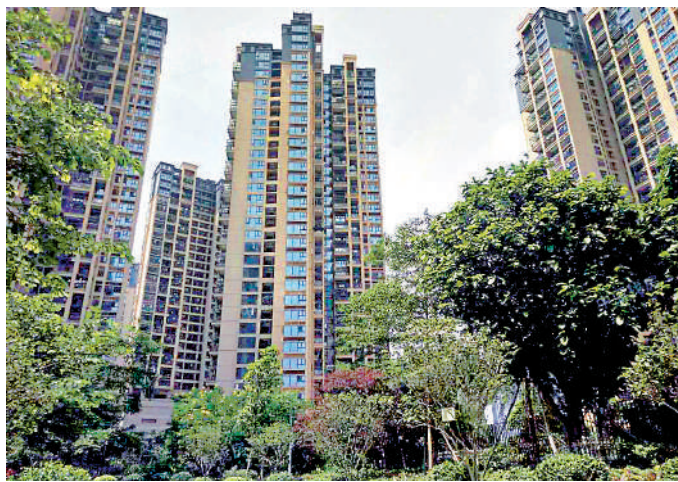
▲信義御城位於橫崗街道核心，綠化率高。