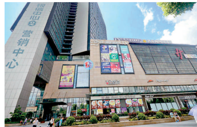
▲銀信中心為公寓項目，建築面積12萬平米。