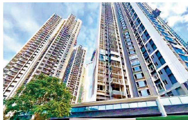
▲名居山河里由11幢高層住宅組成，戶型方正實用。

龍崗區第三人民醫院、深圳龍翔醫院等醫療機構。另外，屋苑鄰近面積達7萬平米的龍崗人民公園，東眺梧桐山景，10分鐘直達深圳園山自然生態公園，居住環境優越。