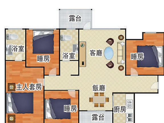
▲銀信中心88平米四房兩廳戶型圖。

金融方面，附近有多個銀行機構，為居民和商業活動提供全方位的金融服務。醫療健康方面，項目附近有橫崗人民醫院和龍翔醫院，無論是日常的健康檢查還是緊急醫療需求，都能得到及時的照顧。