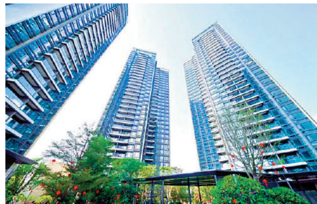
▲星河盛境3期為大型綜合項目，設有住宅、寫字樓及商場。