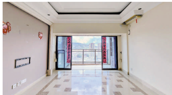
▲信義御城共2677伙，主力戶型面積介乎60至140平米。