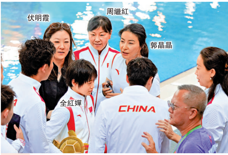
四代同框 四代「跳水皇后」周繼紅、伏明霞、郭晶晶和全紅嬋同場，難得一見。