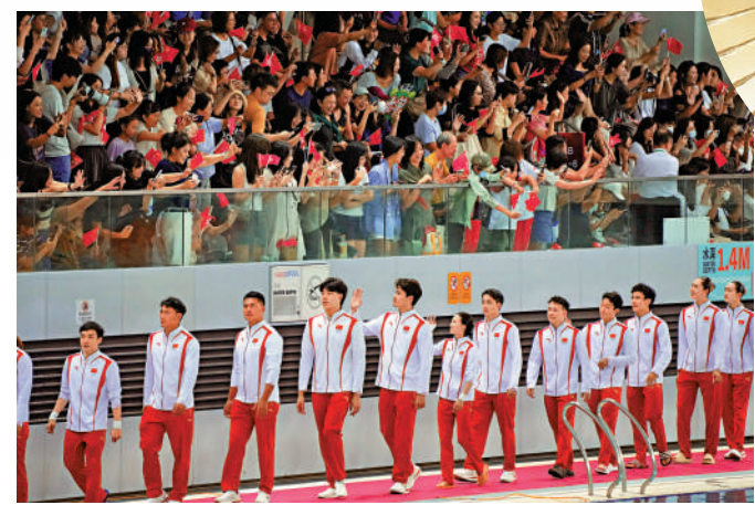
▲健兒們走進會場，觀眾揮舞國旗和區旗，迎接。