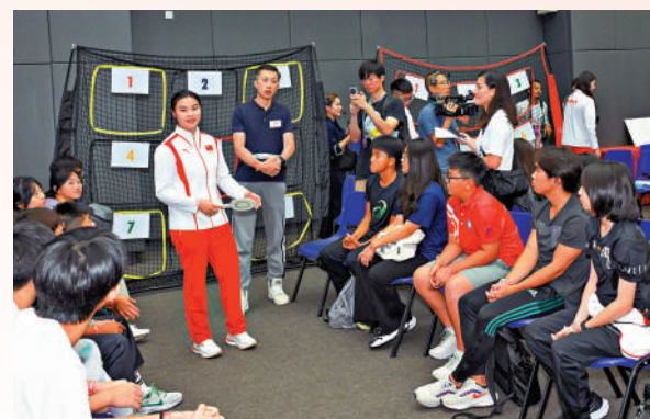
▲國家隊奧運健兒到訪都會大學，與學生及香港運動員交流。