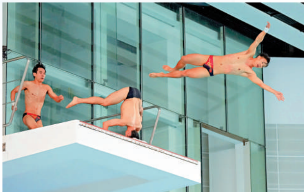
▲跳水隊成員昨日展示多款自創招式，以別開生面的方式躍入水中。