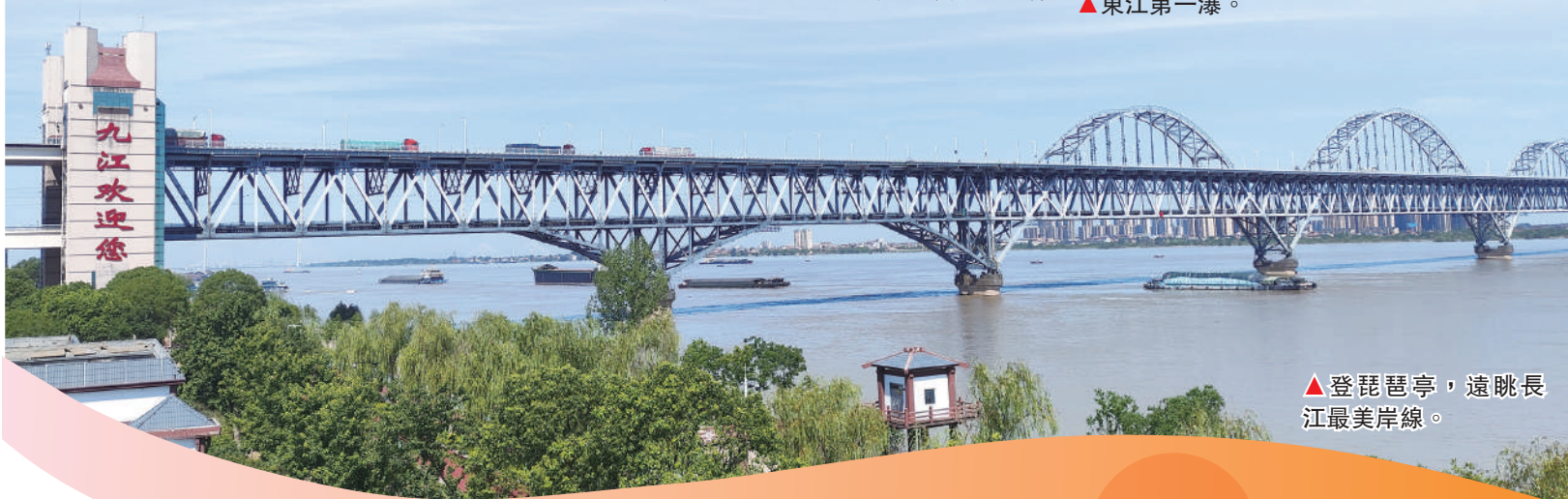
▲登琵琶亭，遠眺長江最美岸線。