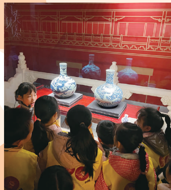
▲「御瓷歸來」展覽現場。

據悉，江西有着10000年制陶史、1000多年官窯史、600多年御窯史。景德鎮御窯廠建於明洪武二年，歷經明清兩朝27位皇帝，燒造御瓷長達542年。這裏集中了最優秀的人才，最精湛的技藝，最精細的原料，最充足資金，造出了許多精美絕倫的瓷器，成為真正的無價之寶。如今，故宮裏收藏的90多萬件陶瓷製成品中，90%以上都是在這裏承燒定製的。