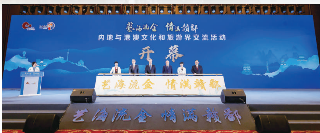
▲「藝海流金·情滿贛鄱」內地與港澳文化和旅遊界交流活動啟動儀式。

作文化、青銅文化、陶瓷文化、書院文化、紅色文化等璀璨奪目，在中華文明史上佔有十分重要的地位。今年5月，尹弘專題調研文化遺產保護傳承工作，並召開全省文化遺產保護傳承座談會。他表示，要切實加強文化遺產系統性保護，要持續深化贛鄱文化的研究闡釋，要扎實做好文化遺產活化利用的文章。