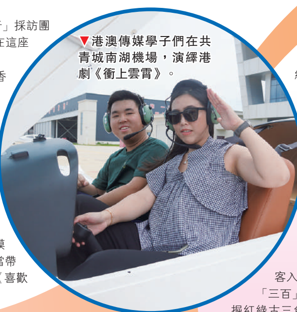
▼港澳傳媒學子們在共青城南湖機場，演繹港劇《衝上雲霄》。