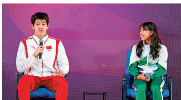
▲游泳運動員潘展樂（左）在活動中回答澳門運動員的提問。

巴黎奧運國家隊代表團昨日（1日）繼續到訪澳門行程，與市民和學生親切交流，分享參與奧運的心路歷程和喜悅。當天上午，潘展樂、馬龍、全紅嬋等65位國家隊奧運健兒來到澳門奧林匹克體育中心，與當地青少年真情對話、互動交流。主持人每喊到一位運動員的名字，都會引來熱烈的掌聲和歡呼聲。