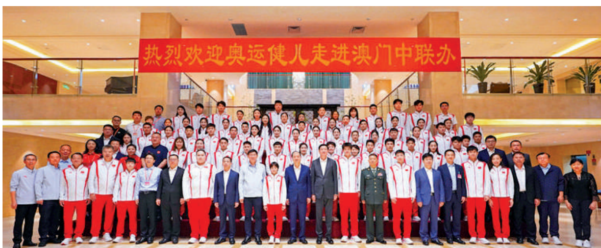
▲中央政府駐澳聯絡辦昨日歡迎國家隊奧運健兒代表團到訪。

鄭新聰首先祝賀我國體育健兒在奧運會上取得優異成績。他表示，習近平總書記強調，在巴黎奧運會上，你們團結一心、頑強拼搏，奮勇爭先、不負使命，取得我國參加夏季奧運會境外參賽歷史最好成績，實現了比賽成績和精神文明雙豐收，為祖國和人民贏得了榮譽。奧運健兒代表團訪問澳門，是一項優良傳統，充分體現了中央對澳門的關懷和厚愛，體現了澳門同胞深厚、強烈的愛國情感，更體現了國家奧運健兒與澳門「一國兩制」事業的特殊緣分，必將為澳門「一國兩制」事業行穩致遠提供更好條件、注入強勁動力。25年來，在中央堅強領導和祖國內地大力支持下，澳門特區政府和社會各界人士同心協力，開創了澳門歷史上最好的發展局面，譜寫了