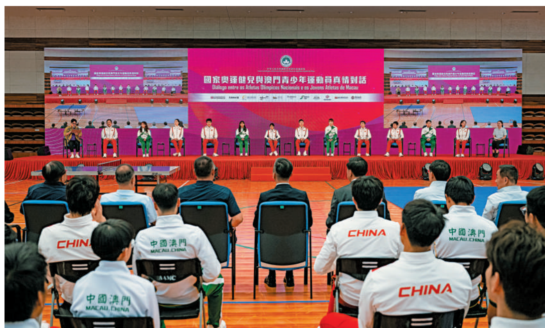
▲國家隊奧運健兒代表團在澳門奧林匹克體育中心室內體育館，與澳門青少年運動員進行互動交流。 新華社

2日上午，代表團將分批探訪3個社會服務機構，與市民互動交流，同日下午結束訪問行程返回內地。