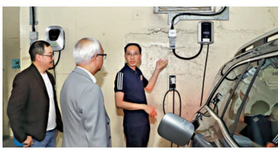
▲位於元朗區的屋苑，自安裝了充電基礎設施的一年間，屋苑的電動車數量由10輛快速上升至100輛，並且還在快速增加中。

謝展寰說，截至7月底「EV屋苑充電易資助計劃」的724份獲批申請中，106個屋苑停車場已完成安裝工程，75個屋苑已展開工程，年底會有約33000個停車位具備充電基礎設施。他提到，政府2011年發出技術指引，訂明新建樓宇的停車場必須具備可為電動車提供充電設備的基礎條件，才可獲總樓面面積豁免。現時政府已批出超過86200個相關停車位，其中逾35800個停車位已落成，並備有電動車充電基礎設施，相信充電基礎設施會是未來所有新建樓宇停車位的標準