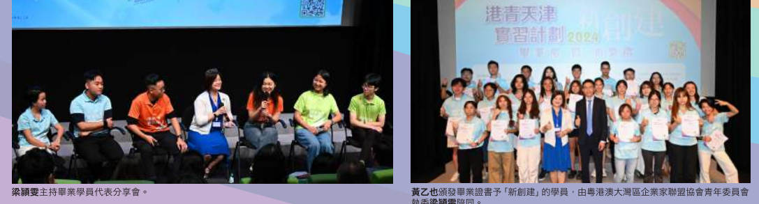
梁潔正主持畢業學員代表分享會。黃乙也頒發畢業證書予「新創建」的學員，由粵港澳大灣區企業家聯盟青年委員會秘書長關卓超陪同。

由香港特區政府民政及青年事務局和青年發展委員會合辦的「青年內地實習資助計劃」資助，香港天津工商專業婦女委員會、粵港澳大灣區企業家聯盟及蔡冠深基金會主辦的「港青天津實習計劃2024」已圓滿結束，日前於香港藝術中心舉行畢業禮暨頒獎禮，得到民政及青年事務局副局長梁宏正以及中央政府駐港聯絡辦青年工作部副處長黃乙也親臨主禮，近百名參與學員及家長出席，一同分享於天津實習的體驗。