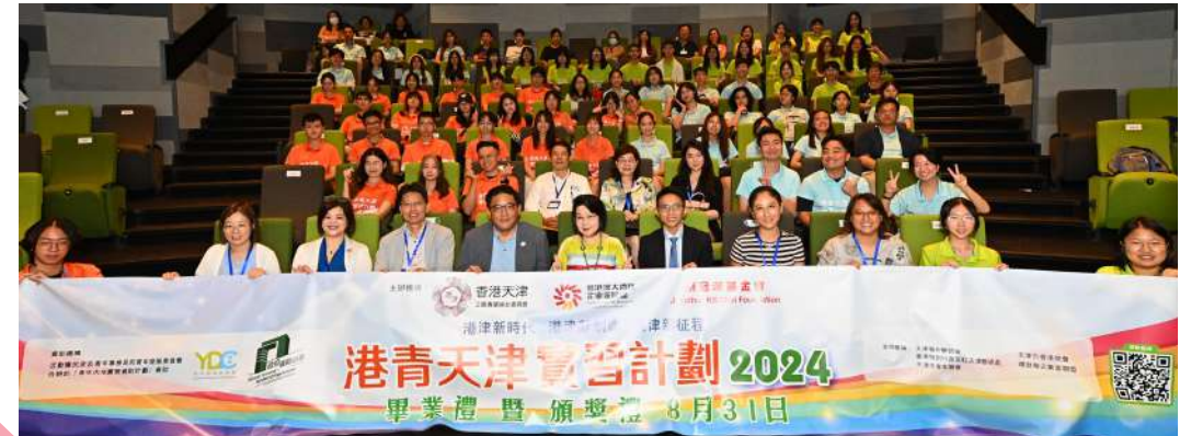
主禮嘉賓、主辦機構及支持機構代表、畢業學員和家長全體大合照。