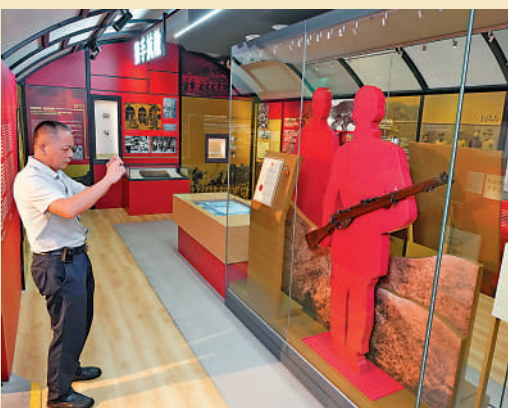
▲市民今日起可免費入場參觀「攜手抗敵：東江縱隊在深港地區的抗戰活動」專題展覽。

日佔期間，東江縱隊港九大隊有155名烈士為保衛香港獻出了寶貴生命。港九獨立大隊及其影響下香港民眾擊斃日軍的史跡和遺址，成為香港珍貴的歷史記憶。