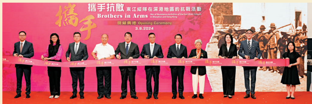
▲香港抗戰及海防博物館昨日舉行「攜手抗敵：東江縱隊在深港地區的抗戰活動」專題展覽開幕典禮，一眾嘉賓在典禮上合照。