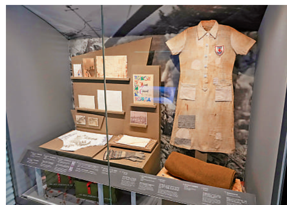
▲展覽展出戰俘的物品及醫療服務輔助制服等。