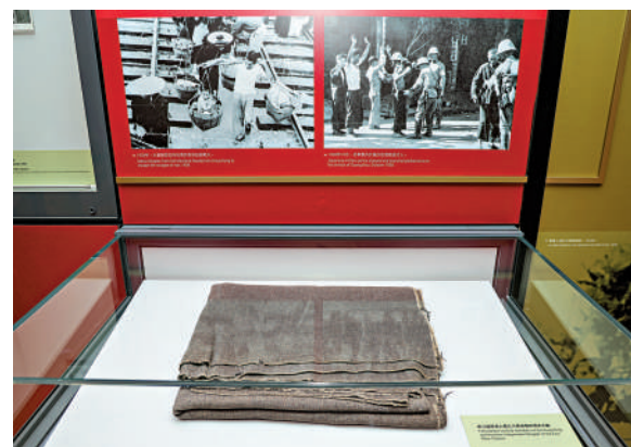
▲東江縱隊港九獨立大隊成員在抗戰時所用的毛氈。