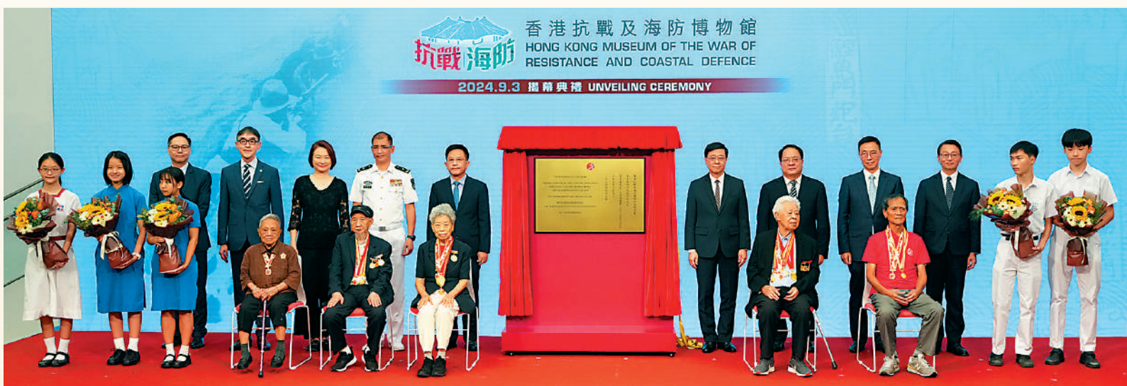
▲行政長官李家超昨日出席香港抗戰及海防博物館揭幕典禮，與其他嘉賓和抗戰老戰士合照。

香港抗戰及海防博物館昨日正式揭幕，市民即日起可免費入場參觀。博物館內現有的四個有關抗戰歷史的展覽廳「聲影說抗戰」、「日本侵華·攜手抗敵」、「日軍侵港」及「抗日游擊隊與敵後活動」組合命名為「抗戰主題展覽廳」，並透過展出大量歷史圖片及文物，以及多媒體節目，展示抗戰歷史和東江縱隊港九獨立大隊的敵後活動，彰顯其重要貢獻。