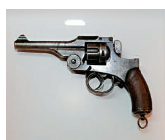
▲日軍二六式左輪手槍。