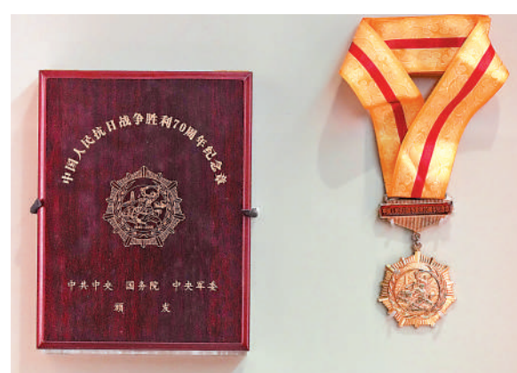
▲中國人民抗日戰爭勝利70周年紀念章連木盒。