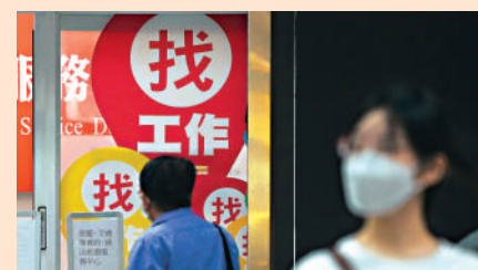
▲台灣明年最低工資將上調4%。資料圖片