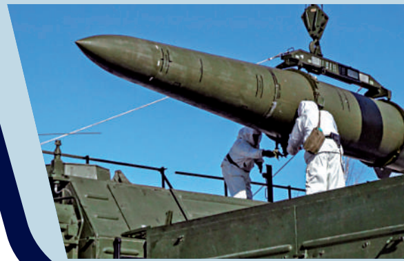
▲ 俄軍在演習中，將一枚「伊斯坎德爾」導彈裝載到移動發射器上。

里亞布科夫稱，有關文件正在敲定，但現在談論具體的發布時間還為時過早，「考慮到我們談論的是國家安全最重要的領域，完成的時間表是一個相當複雜的問題」。