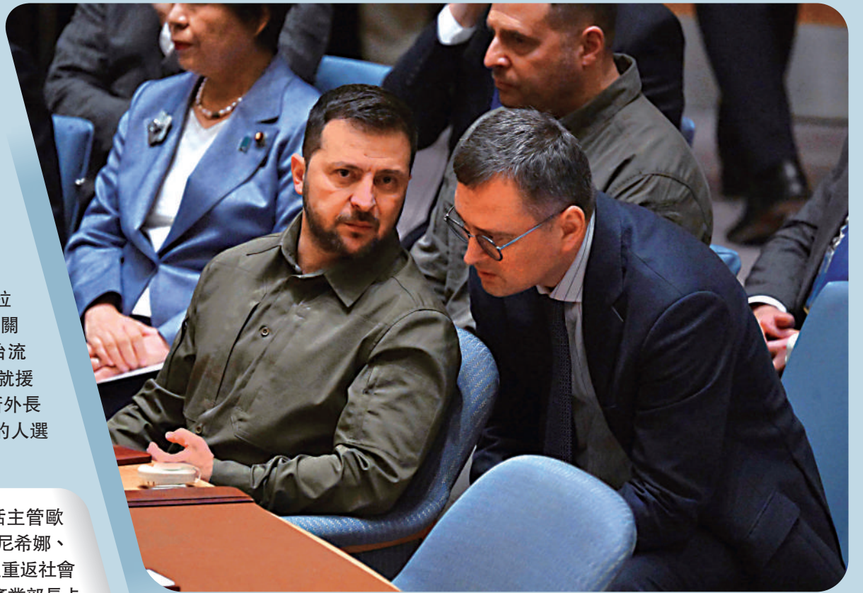
▲ 烏克蘭總統澤連斯基和外長庫列巴(右)。

【大公報訊】烏克蘭最高拉達主席斯特凡丘克4日稱，外長庫列巴已遞交辭呈。這項辭職申請將在最近的一次最高拉達全體會議上進行審議。庫列巴未透露辭職原因。最有可能接替庫列巴的人選是烏第一副外長西比加。