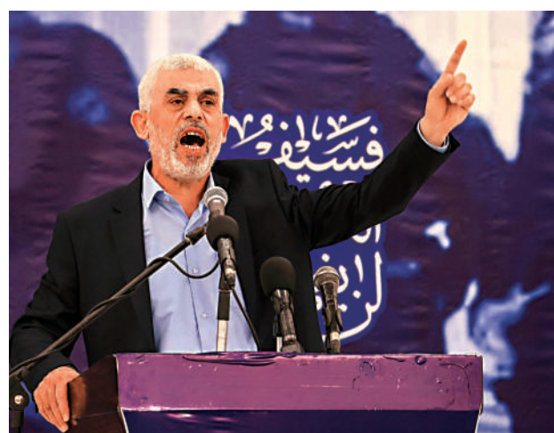
▲ 哈馬斯政治局領導人辛瓦爾。

以色列國防軍陸軍總司令亞代以「個人原因」為由於3日提出辭職，已獲得批准，將在未來幾周卸任。知情人士透露，亞代是因為晉升無望而辭職。他此前被認為是以軍副總參謀長一職的有力候選人，但現任副總參謀長巴拉姆任期可能將延長，且以軍參謀長哈萊維也未顯示出舉薦亞代之意。