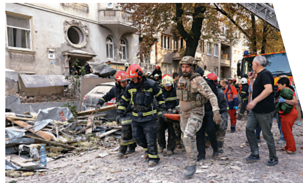
▲ 靠近波蘭邊境的利沃夫市4日遭俄軍空襲，至少7人死亡。