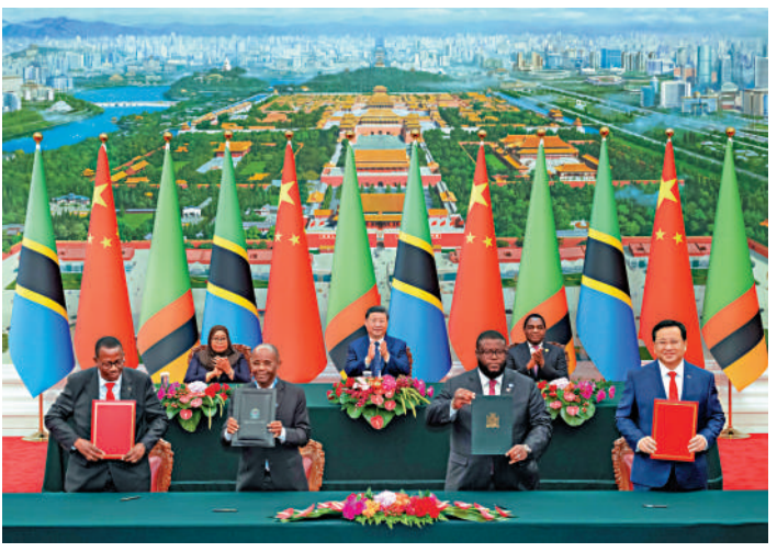
▲9月4日上午，國家主席習近平在北京人民大會堂同來華出席中非合作論壇北京峰會的坦桑尼亞總統哈桑、贊比亞總統希奇萊馬共同見證簽署《坦贊鐵路激活項目諒解備忘錄》。新華社

論壇共同主席國塞內加爾總統法耶代表非方領導人感謝友好的中國人民給予的盛情款待和周到安排，表示非中友好根基深厚、源遠流長，雙方理念相近，平等相待、相互尊重、互利共贏、團結合作，都主張建設一個更加平等有序、普惠包容的世界。在習近平主席領導下，中國不僅實現自身快速發展，而且為促進世界和平與增長作出重要貢獻。非方高度讚賞習近平主席提出的系列重要倡議以及為推動中非合作包括論壇機制建設作出的重要貢獻，願同中方加強團結合作，深化非中全面戰略合作夥伴關係，更好維護共同利益。