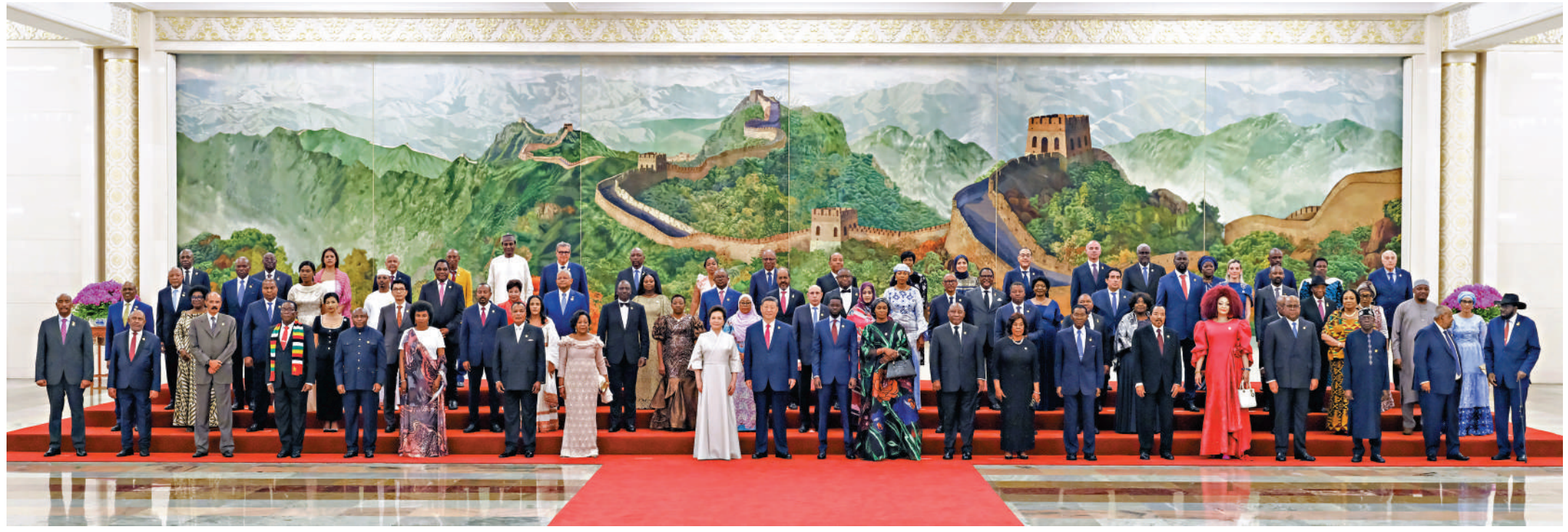
▲9月4日晚，國家主席習近平和夫人彭麗媛在北京人民大會堂舉行宴會，歡迎來華出席中非合作論壇北京峰會的國際貴賓。這是宴會前，習近平和彭麗媛同貴賓們集體合影留念。