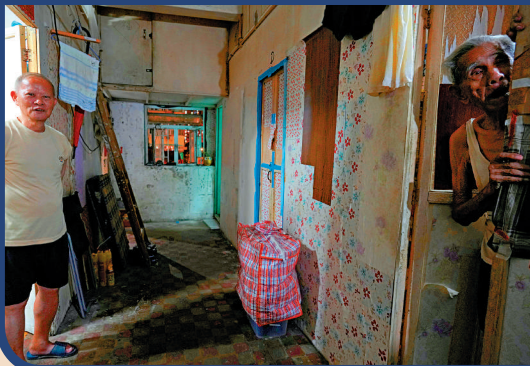
▲劊房居住環境有欠理想,但相對廉宜的租金,對不少低收入人士來說,是唯一可負擔的居所。