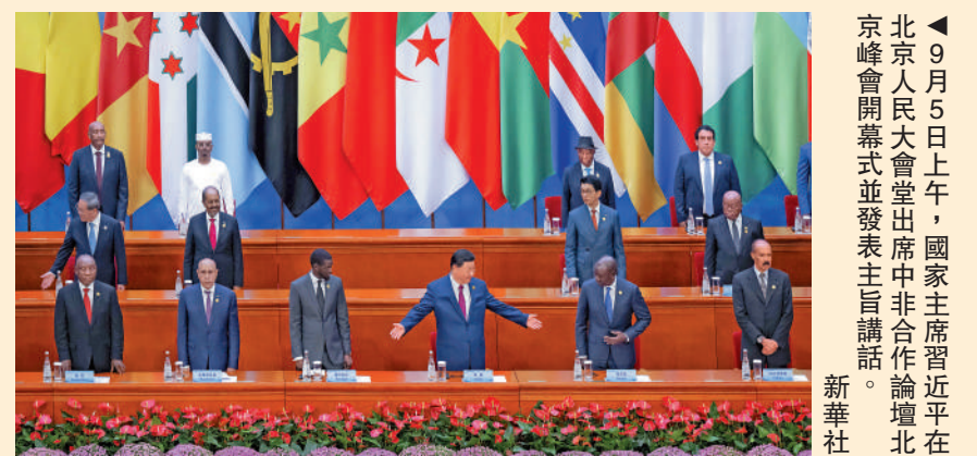
9月5日上午，國家主席習近平在北京人民大會堂出席中非合作論壇北京峰會開幕式並發表主旨講話。

《宣言》表示，我們願攜手落實全球文明倡議，加強文明交流，促進民心相通。中方鼓勵中國企業加強對所僱用非洲員工的培訓和學歷教育。我們將進一步擴大教育、科技、衛生、旅遊、體育、青年、婦女、智庫、媒體和文化等領域交流合作，支持中非友好事業的社會基礎。中方支持2026年在達喀爾舉行青年奧林匹克運動會。中非將加強科技、教育、經貿、文化、旅遊等各領域人員往來。