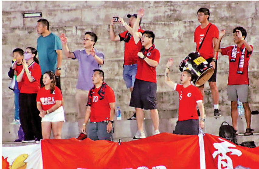
▲逾十名香港球迷專程到訪斐濟，為港足打氣。

港足兩日後便會在香港時間早上11時，與同樣取得1勝的東道主斐濟隊爭冠，不過港足由於得失球佔有優勢，屆時對陣斐濟隊只要保持不敗，便可成為三角賽冠軍，所羅門群島隊繼續給斐濟隊再大敗於港足腳下，以兩戰皆負完成賽事。