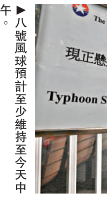
▲八號風球預計至少維持至今天中午。