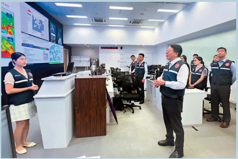
提早回家 ▲天文台提前半日預告掛八號風球，不少市民昨日下午提早放工回家。大公報記者麥潤田攝 做足準備 ▲尖沙咀有商戶趕緊在八號風球懸掛前，在舖前加裝擋水板。大公報記者麥潤田攝 統籌協調 ▲陳國基昨晚到緊急事故監察及支援中心，聽取匯報「摩羯」的最新情況。