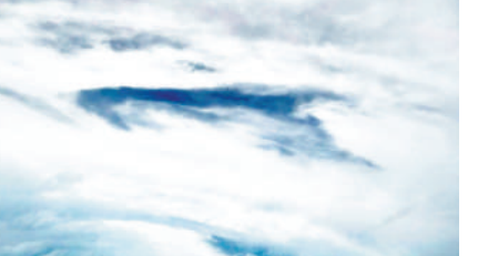
▲天文台昨日再與政府飛行服務隊合作，在「摩羯」上空投放「下投式探空儀」，以分析風力結構、強度、位置等。「摩羯」中心風速達每小時210公里，高於2017年襲港的「天鴿」和去年襲港的「小犬」。