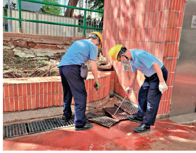
▲八號風球期間，水浸黑點之一的杏花邨海旁出現巨浪拍岸。 ▲房屋署屋邨管理與地盤管理人員在颶風迫近之際，已聯同物業管理公司和承建商，做好應對措施。