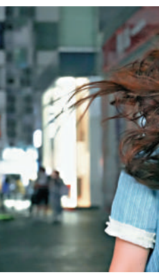
▲「摩羯」風勢強勁，街上行人頭髮亦被吹亂。