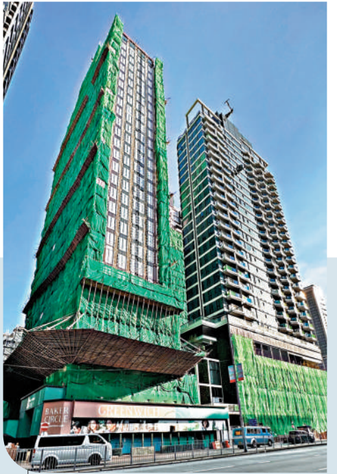
▲今年首8個月獲批預售住宅樓花不足3700個單位，創十七年來同期新低。