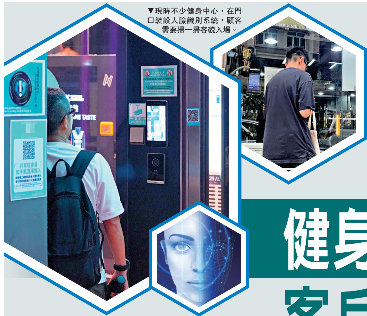
▼現時不少健身中心，在門口裝設人臉識別系統，顧客需要掃一掃容貌入場。