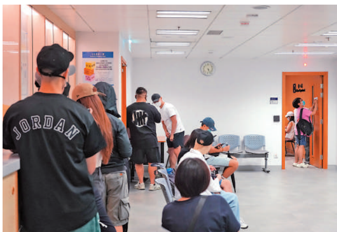
▲大批舒適堡員工到勞工處登記個人資料。

積金局昨日針對該事件回應，稱「舒適堡」未為約740名員工繳交6月及7月強積金供款及附加費，涉及總金額約300萬元，積金局已與舒適堡跟進，要求立刻補交欠款，否則局方會入稟法院向舒適堡作出民事申索，為受影響員工追討強積金欠款及附加費。至於2024年8月份的強積金供款，有關供款日為9月10日，如舒適堡未能於供款日作出供款，局方會適時採取適當的法律行動。