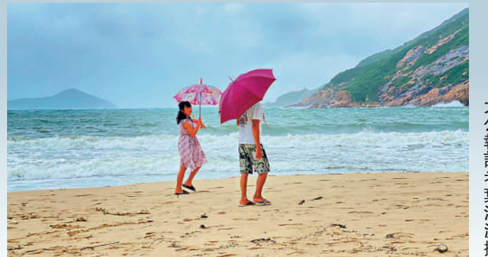
▲八號風球期間石澳泳灘關閉，但仍有入走進沙灘範圍散步。

「摩羯」襲港未有造成嚴重破壞，風後市面有序復常。天文台周四晚上提前預告八號烈風或暴風信號會維持至昨午12時，意味着打工仔昨早有突如其來的「半日颱風假」。網民大讚天文台提前預告的做法，稱「今次安排得好好，要讚揚一下」、「天文台做到盡啦」、「賺了半日颱風假」等。