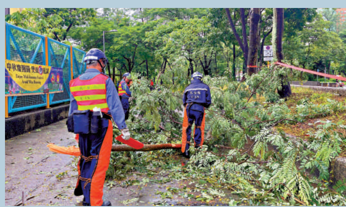
▲當局昨日錄得一百一十九宗塌樹報告，民安隊協助清理。