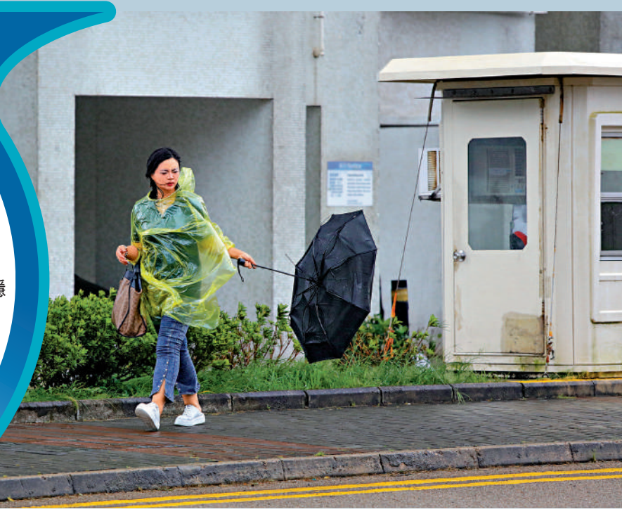
▲在杏花邨，昨日仍有狂風暴雨，途人拿着被吹翻的雨伞，甚為狼狽。