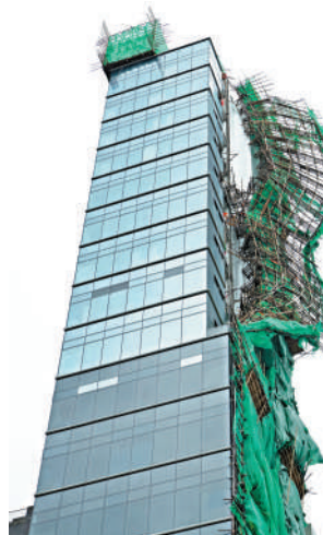
▲尖沙咀有商廈外牆棚架被吹至搖搖欲墜。

市民張先生應女兒要求來沙灘吹風散步，他說不會走近海邊，又表示今次感受到的風勢較去年的弱。對於早前有人闖灘進行水上活動，他認為不應該冒自己或他人的生命安全來玩，一旦發生意外，要其他人冒險拯救，構成不必要的風險，因此他贊成新例，亦希望水上活動愛好者自律。張先生女兒則表示，覺得風勢不大，多了一日「風假」很開心，來沙灘吹風很舒服。