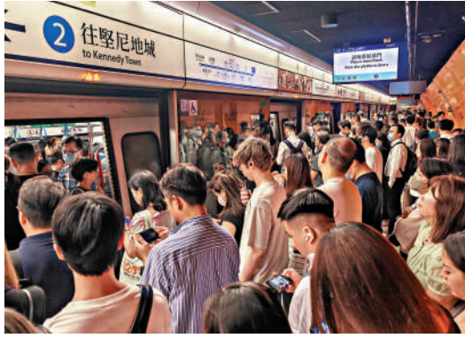
▲八號風球除下後，市民趕返公司，港鐵站內擠滿上班族。

隨「摩羯」逐漸遠離本港，天文台在昨午12時40分改掛三號強風信號，不少「打工仔」放了半日「風假」後出門上班，海陸交通在下午陸續恢復正常，運作大致暢順。天文台昨午改掛三號強風信號後，港鐵班次開始加密，其中金鐘站人潮逐漸湧現，市民或需等候多一班車才能成功上車，紅磡站情況相若；各巴士路線亦陸續恢復，不少都擠滿乘客，巴士公司安排職員維持秩序。