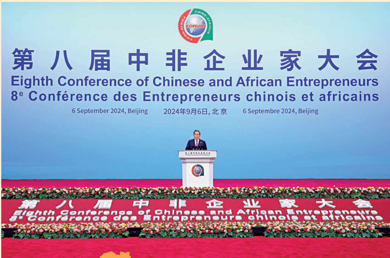
9月6日上午，國務院總理李強在北京國家會議中心出席第八屆中非企業家大會開幕式並致辭。

「截至今年8月末，我們在非洲累計發放貸款650億美元，旗下中非發展基金累計在非洲投資決策76億美元，帶動企業投資320億美元。」國家開發銀行行長譚炯介紹，多年來，國開行聚焦基礎設施、能源、礦業、製造業等重大領域，支持了尼日利亞萊基港、埃及泰達·蘇伊士經貿合作區等一大批標誌性重大工程，夯實經濟社會發展基礎。同時，運用非洲中小企業發展專項貸款，為當地創造了27萬個就業崗位，助力提升非洲人民的獲得感、幸福感。