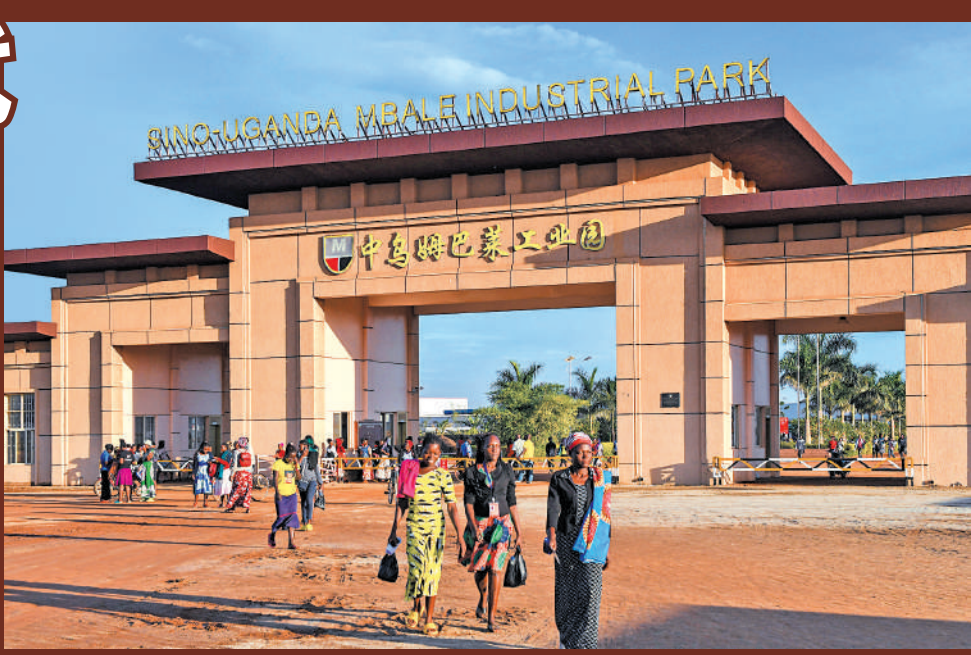
今年4月4日下午，在烏干達姆巴萊市，人們走出中烏姆巴萊工業園。