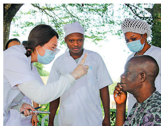
6月6日，中國援貝內醫療隊醫生為當地居民篩查眼科疾病。