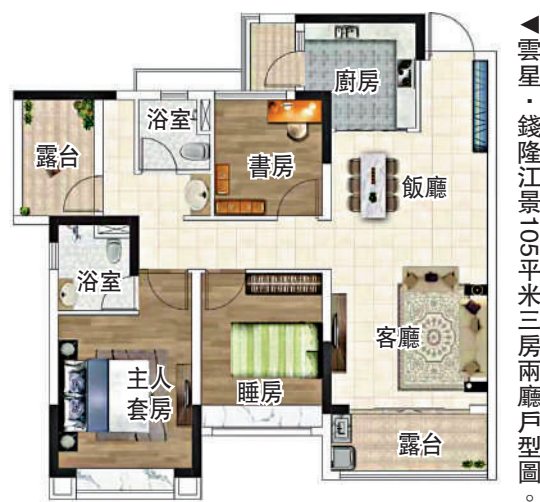
▲雲星·錢隆江景105平米三房兩廳戶型圖。

雲星·錢隆江景共442伙，主力戶型面積75至105平米，間隔由兩房至三房。其中，75平米為兩房兩廳，客廳與飯廳接連觀景露台，享受大空間生活；U形廚房人性化設計，洗切煮分區明確；主人房和睡房均為南向，採光通風不受限制。90平米為兩房兩廳戶型，方正格局，入戶玄關有分類儲物空間；L形廚房動線明確，高效收納；兩間睡房分置兩邊，互不干擾。105平米為三房兩廳間隔，三開間朝南，雙露台設計，功能實用；L形廚房收納充足，與飯廳、客廳連接，空間感十足。