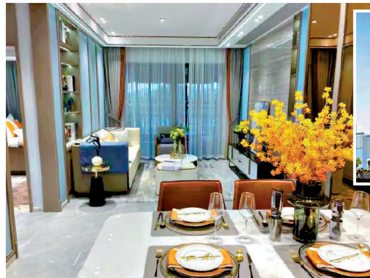
▲雲星·錢隆江景位於從化街口核心生活圈。