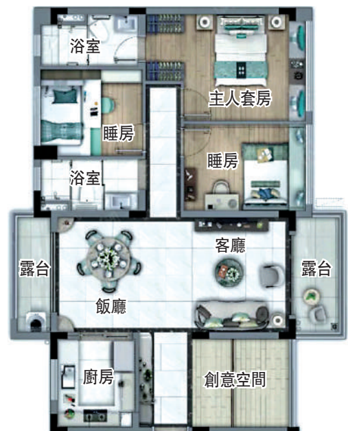
▲碧桂園鉅悅府120平米三房+一房兩廳戶型圖。