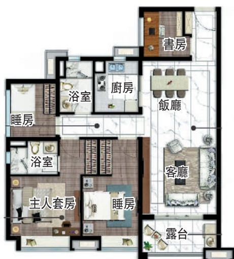
▲保利時代107平米四房兩廳戶型圖。

此外，保利時代配置1.45萬平米商業街和3000平米獨立商場，將有超市、快餐店、便利店、電影城等，足不出戶滿足衣食住行。想走遠一點，10分鐘覆蓋到廣百和欣榮宏兩大商圈。