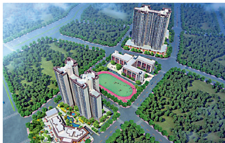
▲碧桂園鉅悅府綠化率高，並與風雲嶺森林公園為鄰。