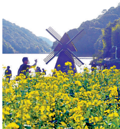
▲廣州從化區環境優美，湖泊眾多，森林覆蓋率高達67%。