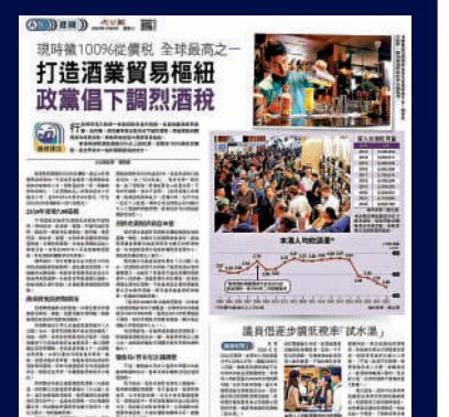
▲大公報早前報道多個政黨建議下調烈酒稅。