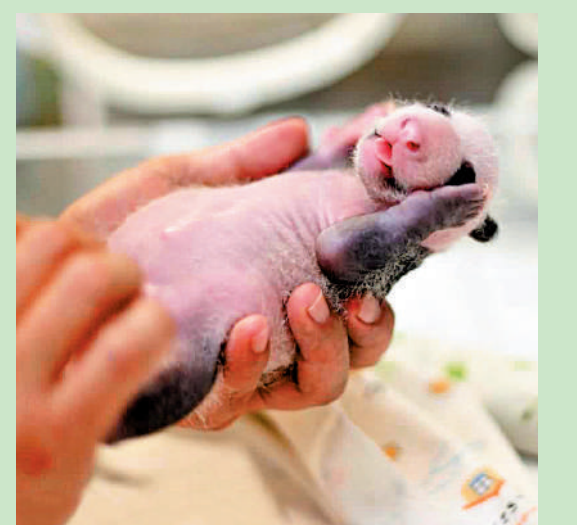
▲「細佬」身上黑色「小背心」「黑眼圈」越來越明顯。

熟睡，「細佬」則攤在護理員手上。網民留言大讚兩姐弟勁可愛。 有網民建議，海洋公園可參考韓國「福寶」長大的紀錄片電影，希望香港的大熊貓仔寶亦可以在全港大熊貓迷的見證及愛護下成長。有網民則希望海洋公園盡快推出仔寶的周邊產品，表示若有仔寶不同階段的1比1公仔推出，相信會很受歡迎。