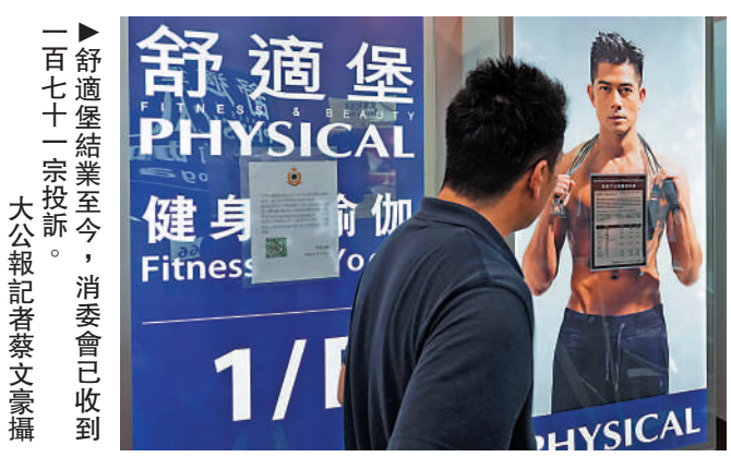
一百七十一宗投訴。

【大公報訊】記者馮京報道：全港有21間分店的連鎖健身集團舒適堡前日（6日）宣布「暫時全面結業」。舒適堡官方網站昨晚發出通告，表示經多番協調，新投資者與灣仔分店原址的業主已達成初步共識，新公司將以「Healthy」品牌營運，並承諾為舒適堡原有客戶免費提供餘下所有健身咭及私人教練課堂服務，灣仔店將於日內重開。