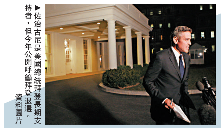
▶佐治古尼尼是美國總統拜登長期支持者，但今年公開呼籲拜登退選。

在今年的大選中，有觀點認為荷里活的影響力巨大，甚至成了這齣政治大戲的「共同主演」。8月，民主黨大會邀請了一眾荷里活明星站台，而無論是特朗普還是其副手JD萬斯，其成名都離不開荷里活夢工廠的加持。(綜合報道)