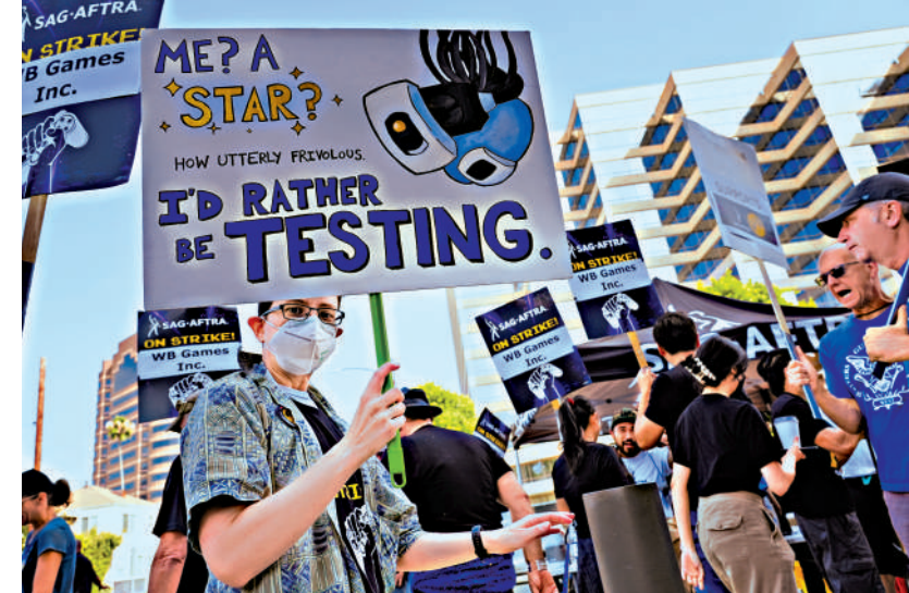
▲去年8月荷里活的編劇和演員大罷工影響大量電影的製作。