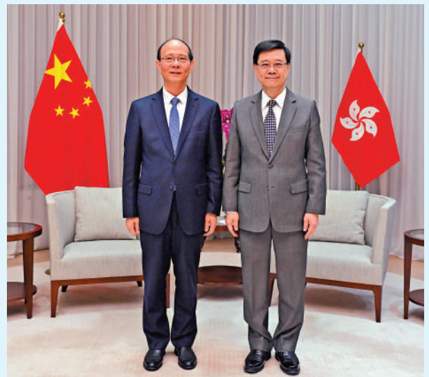
▲李家超（右）與吳曉軍會面，就深化青港交流合作交換意見。