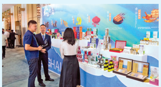
▲在青海設立的港資企業累計超過340家，港資投資超過37億美元。