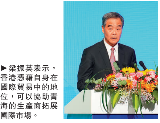
▲梁振英表示，香港憑藉自身在國際貿易中的地位，可以協助青海的生產商拓展國際市場。

展望未來，李家超指出，將繼續用好香港的「超級聯繫人」和「超級增值人」角色，與青海攜手加強合作。香港專業服務等方面的優勢，可以結合青海「四地」高質量發展，與青海實現優勢互補，共同為國家發展新質生產力注入新動能。