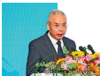
▲靳生壽稱，青海綠色有機農畜產品遠銷世界36個國家。

靳生壽稱，青海積極打造綠色有機農畜產品輸出地，現時已經創建6個國家級現代農業產業園，5個優勢特色產業集群，培育183間省級以上的農牧業重點龍頭企業，打造8個市州區域公用品牌，以提升青海產品的知名