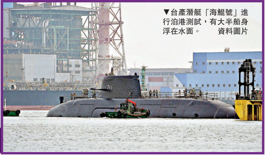
▼台產潛艇「海鯤號」進行泊港測試，有大半船身浮在水面。