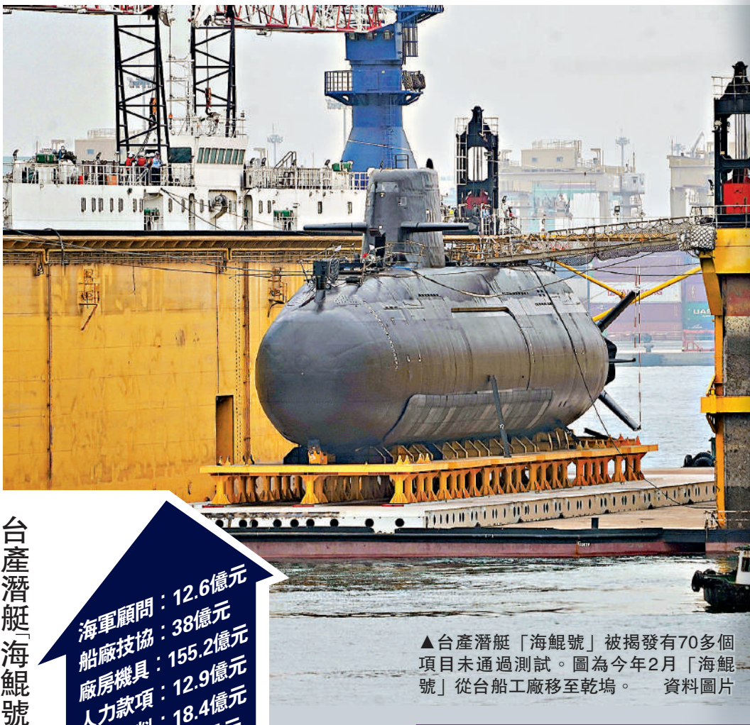
▲台產潛艇「海鯤號」被揭發有70多個項目未通過測試。圖為今年2月「海鯤號」從台船工廠移至乾塢。 資料圖片

2」模式。 「海鯤號」是台灣自行建造的首艘常規潛艇，被台當局視為「自主國防」的「威懾武器」。不過由於台灣方面的技術能力有限，該潛艇雖然名為「自製」，其實採用了大量進口設備，台灣方面有沒有能力將這些來源不同的設備進行有效整合也備受質疑。 「海鯤號」於2021年11月動工，2023年9月舉行命名下水儀式。今年7月15日，該潛艇被拖往高雄港91號碼頭進行繫泊試驗。台媒稱，目前該潛艇已完成魚雷裝載，原本外界預期它將在9月出海海試，前台灣海軍顧問郭璽此前甚至明確宣稱「將在9月15日之前海試」，但他最近改口稱「今年年底前能出海已是奇跡」。郭璽透露，原先負責總領該項目的黃曙光請辭後，台船「群龍無首」，且內部有「麻煩製造者」扯後腿、等着看笑話，因此該潛艇「今年年底能出去，都已經是奇跡了」。郭璽還爆料稱，台船為了省錢，最近解僱了該潛艇的所有海外技術顧問，導致同型潛艇的後續建造恐怕難以銜接。 《中國時報》刊文指出，台軍「自造」潛艇的問題爭論已久，台灣有沒有能力「自造」是一個問題，有沒有必要「自造」是另一個問題。只有爭取兩岸和平發展，才是長治久安之道。是否有必要大舉造艦，民進黨當局應三思。