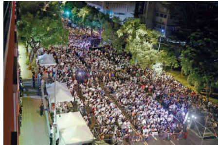
▲民眾黨8日晚在立法機構旁連舉行集會，聲援黨主席柯文哲。 資料圖片

【大公報訊】據中通社報道：涉台北市「京華城案」，台灣民眾黨主席、前台北市長柯文哲遭羈押，其辯護律師9日發表聲明指，因尊重柯文哲個人意