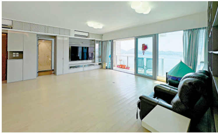
▲薄扶林貝沙灣4房海景大宅以呎價2.8萬元沽出，重返9年前價位。圖為內櫥一隅。

粉嶺上車盤跌至「3字頭」，吸引用家入市。美聯物業區域經理吳偉文稱，粉嶺碧湖花園1座高層G室2房單位，實用面積400方呎，剛獲區內客以366萬元承接，實用呎價9150元。資料顯示，原業主2020年以518萬元買入，持貨4年賬蝕152萬元，貶值29.3%。