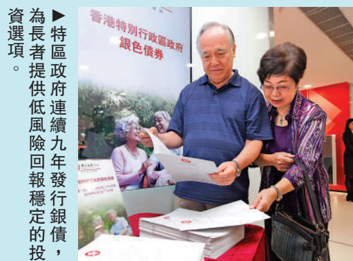
為長者提供低風險回報穩定的債投資選擇。