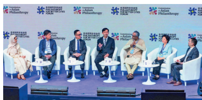
▲2024香港國際慈善論壇一連兩日舉行，今年論壇的主題為「行公益 結碩果」。

亞洲公益慈善研究計劃創始合作機構包括中國宋慶齡基金會、香港賽馬會慈善信託基金、IDEAS Dompot Dhuafa Republika基金會、哈立德國王基金會、日本The Nippon Foundation、Piramal基金會、Rainmatter