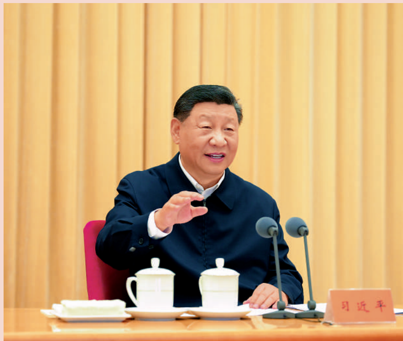
▲9月9日至10日，全國教育大會在北京召開。中共中央總書記、國家主席、中央軍委主席習近平出席會議並發表重要講話，代表黨中央向全國廣大教師和教育工作者致以節日祝賀和誠摯問候。