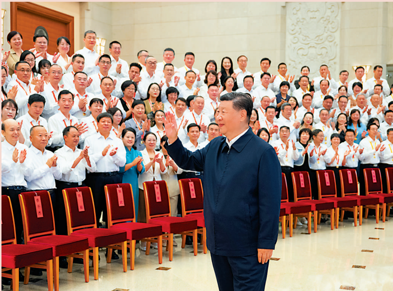
▲9月9日，黨和國家領導人習近平、李強、蔡奇、丁薛祥等在北京接見參加慶祝第四十個教師節暨全國教育系統先進集體和先進個人表彰活動代表。

全國教育大會9日至10日在北京召開。中共中央總書記、國家主席、中央軍委主席習近平出席大會並發表重要講話。他強調，建成教育強國是近代以來中華民族夢寐以求的美好願望，是實現以中國式現代化全面推進強國建設、民族復興偉業的先導任務、堅實基礎、戰略支撐，必須朝着既定目標扎實邁進。習近平指出，建設教育強國是一項複雜的系統工程，需要我們緊緊圍繞立德樹人這個根本任務，着眼於培養德智體美勞全面發展的社會主義建設者和接班人。