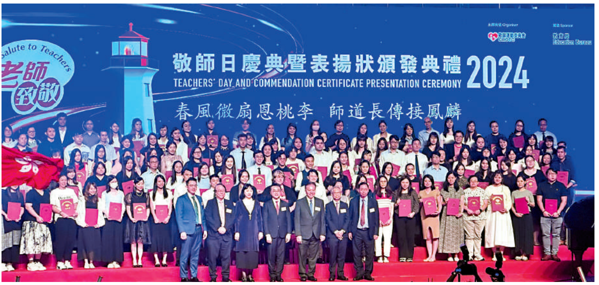
▲「敬師日慶典暨表揚狀頒發典禮2024」昨日舉行，今年有逾1600位老師獲表揚。

由20個教育團體組成的「敬師運動委員會」，透過公開表揚優秀教師，推動尊師重道的傳統美德。今年是該委員會第29年舉辦「表揚教師計劃」，迄今已有逾38000人次獲得嘉許。