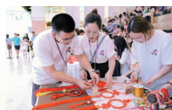
▲學生體驗非遺手工藝製作。