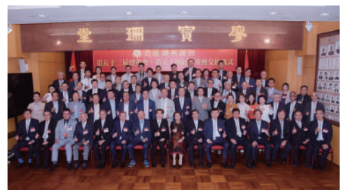
▲一眾嘉賓與參賽選手合影留念。

現場活動為選手加油，並向男女冠亞季軍，及各獲獎者頒發獎盃、獎金，以資鼓勵。柯文華表示：「香港乒乓球運動員在國際比賽中屢屢取得優異成績，給了我們極大的鼓勵和啟示，要將群眾性的體育運動和精英培訓有效結合起來，才能在體育比賽項目上獲得突破，取得好成績，為香港爭光。香港福建體育會將把這項廣益社區的傳統活動繼續辦下去，並爭取與各社會團體多方合作，擴大影響。」