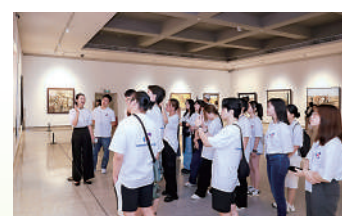
▲同學參觀關山月美術館的「朝聖敦煌」系列畫展。