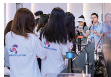
▲國家量子研究院工作人員為學生進行講解。

創業基地，體驗灣區職場文化之餘，更了解到港粵台初創企業在大灣區發展、項目孵化等相關支持政策及多元化服務。在潮玩壹嘉文化傳播（深圳）有限公司等企業實習的同學，則學習到新媒體傳播技能和最新行業動態。