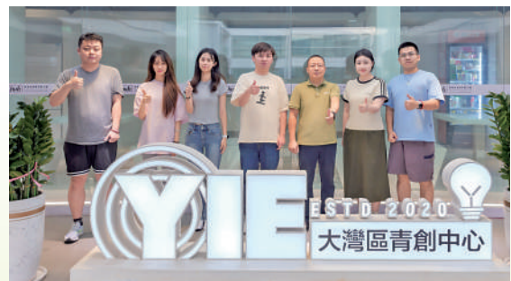
▲學生在實習機構合照。

青年與創科是當今香港的兩大主題，特區政府及香港各界都致力為本港青年提供更多發展機會，以配合香港作為國際創科中心的定位。自2016年開始，嶺南大學中國經濟研究部以創新創業為主題，連續多年舉辦培訓及實習計劃。項目今年繼續獲中央政府駐港聯絡辦、香港特區政府民政及青年事務局、青年發展委員會、香港教育大學環球事務處、香港高等教育評議會、香港青年會、大灣區青年夢之家等機構的鼎力支持，順利安排近50位香港青年前往深圳市多間知名企業，進行為期五周的暑期實習。