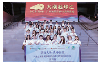
▲同學參觀「深圳大潮起珠江——廣東改革開放40周年展」。