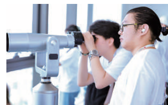
▲同學參觀河套深港科技創新合作區。

2024年夏季，「青年創嶺」大學生創新創業培訓及實習計劃2024深圳篇順利落下帷幕。是次活動透過與一流企業的深度合作，讓參與的同學拓展眼界，收穫了專業知識和寶貴經驗。同時為香港青年搭建了通向創新未來的橋樑，讓其感受到灣區發展的雄厚潛力，對國情及國家發展大局有了更深刻的理解，從中尋覓機遇，探索未來發展方向。（特刊）