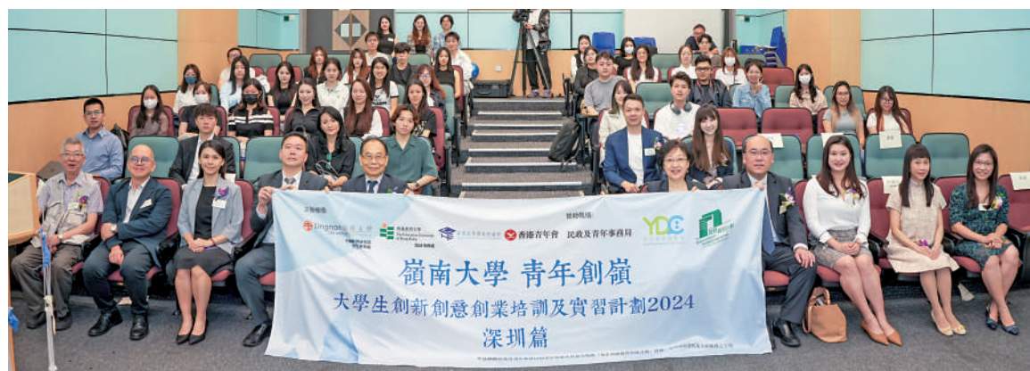
▲「青年創嶺」大學生創新創業培訓及實習計劃2024深圳篇」啟動禮合影。

2024年6月至8月，嶺南大學中國經濟研究部及學生事務處、香港教育大學環球事務處、香港高等教育評議會、香港青年會主辦及大灣區青年夢之家承辦的「青年創嶺」大學生創新創業培訓及實習計劃2024深圳篇成功舉辦。