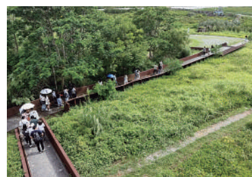
▲學生參觀福田紅樹林自然保護區。