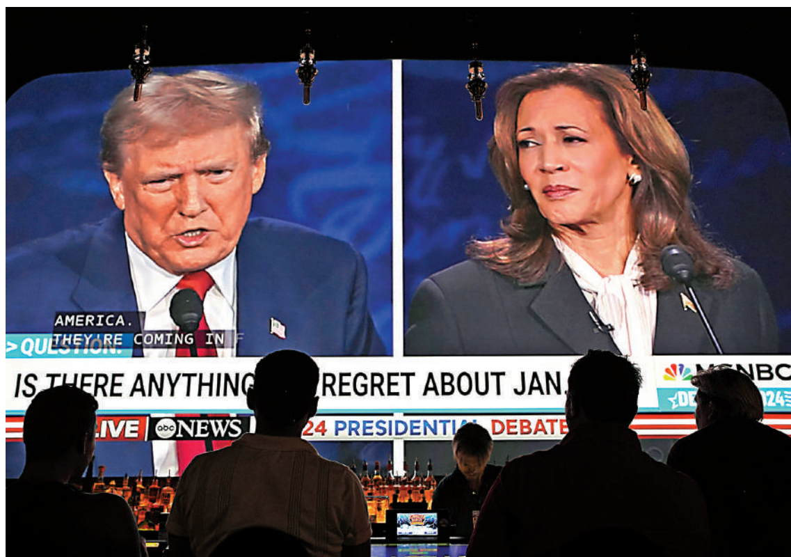
▲民主黨總統候選人哈里斯（右）和特朗普（左）的首次電視辯論。

美國民主黨總統候選人哈里斯和共和黨總統候選人特朗普，當地時間10日晚在賓夕法尼亞州費城進行首次電視辯論。兩人對經濟、非法移民、墮胎權、對外政策等關鍵議題展開激辯。辯論結束後，兩邊陣營都高呼自己獲勝。美媒稱，這場備受關注的辯論淪為一場惡語相向的口水仗。雖然火藥味十足，但並未出現「足以從根本上改變大選格局的致命一擊」。