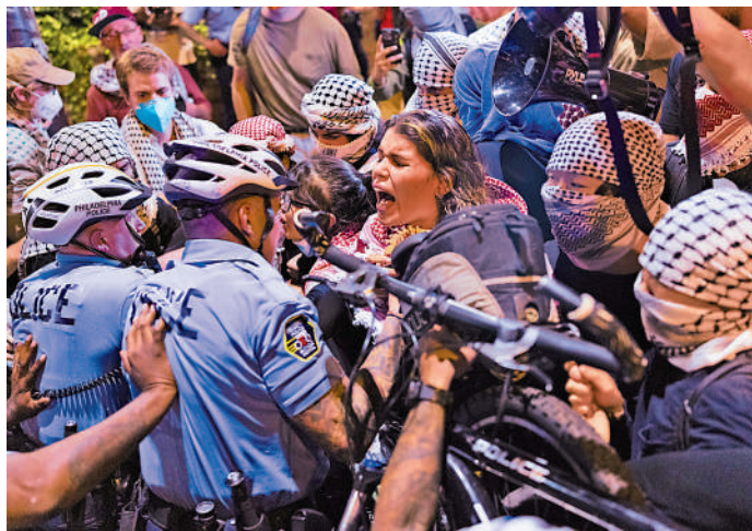
▲支持巴勒斯坦人士10日在費城示威，並與警方發生衝突。

互相尊重的姿態。「我覺得現在的美國已經離這個很遠了。現在兩邊都太極端了。」（綜合報道）