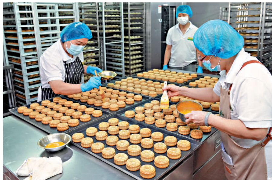
▲銀杏館的員工在中秋前夕，忙於製作各式月餅。