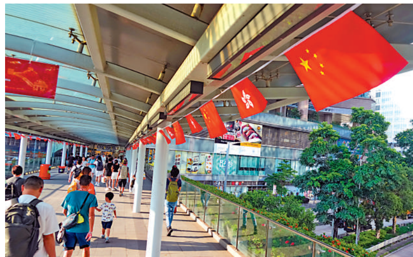
▲今年是中華人民共和國成立75周年華誕，近日香港處處國旗飄揚，洋溢着慶祝氣氛。

社會上亦不少機構在中秋節為基層市民送愛心。九龍樂善堂總幹事劉愛詩表示，九龍樂善堂今年推出2500盒慈善月餅，兩日便全數售罄。此外，有不少市民認購月餅，轉贈於基層家庭，今年共有約1000盒月餅被認購，數量與去年相若。九龍樂善堂將於本週六舉辦中秋慶祝活動，到沙田、大埔、九龍城、深水埗、觀塘等，進行送暖活動，為逾1750戶長者及基層家庭送上禮物及祝福。 大公報記者 劉碩源