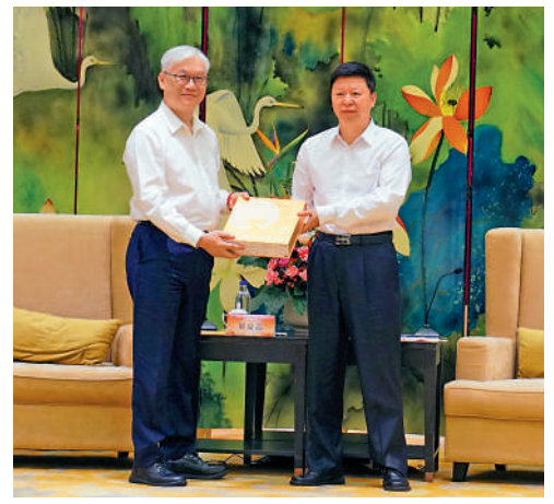
▲中共中央台辦、國務院台辦主任宋濤在福州向到訪的中國國民黨副主席夏立言贈送中秋月餅。

【大公報訊】記者何德花福州報導：9月12日晚，200餘名兩岸同胞在福建省福州市參加以「福滿中秋夜 兩岸一家親」為主題的2024年兩岸同胞迎中秋聯誼活動，當500架無人機在琅岐島海峽青年交流營地夜空中呈現「天涯共此時」「兩岸一家親」等字樣時，現場歡呼陣陣，抒發出兩岸同胞共迎民族佳節的喜悅。本次活動由福州市政府和馬祖縣政府共同主辦，中國國民黨副主席夏立言和馬祖縣長王忠銘、民意代表陳雪生、縣議會議長張永江及縣代表團、在閩台胞代表共約150位台胞參加。活動現場布置中秋花燈及悠遊馬祖、台胞服務、民俗體驗、台企展示等主題展區，