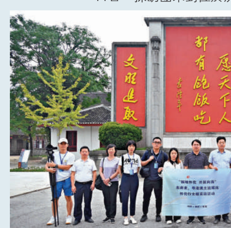
▲採訪團一行在袁隆平院士親書的「飽飯碑」前合影。

位於靖州產業開發區的湖南德歐新材料科技有限公司裏，一堆堆成捆的竹製材料吸引記者們眼球，通過相關負責人介紹，這是經過加工的竹子造的卡車廂板，這是一種全新的綠色材料——定向重組竹集成材和大規格竹纖維複合材。 這家成立於2023年8月的年輕企業，憑藉其先進的竹產品研發、設計、生產和銷售體系，在行業內迅速崛起。公司深入踐行「綠水青山就是金山銀山」理念，積極響應國家「以竹代木、以竹代塑、以竹代鋼」的倡議，走出一