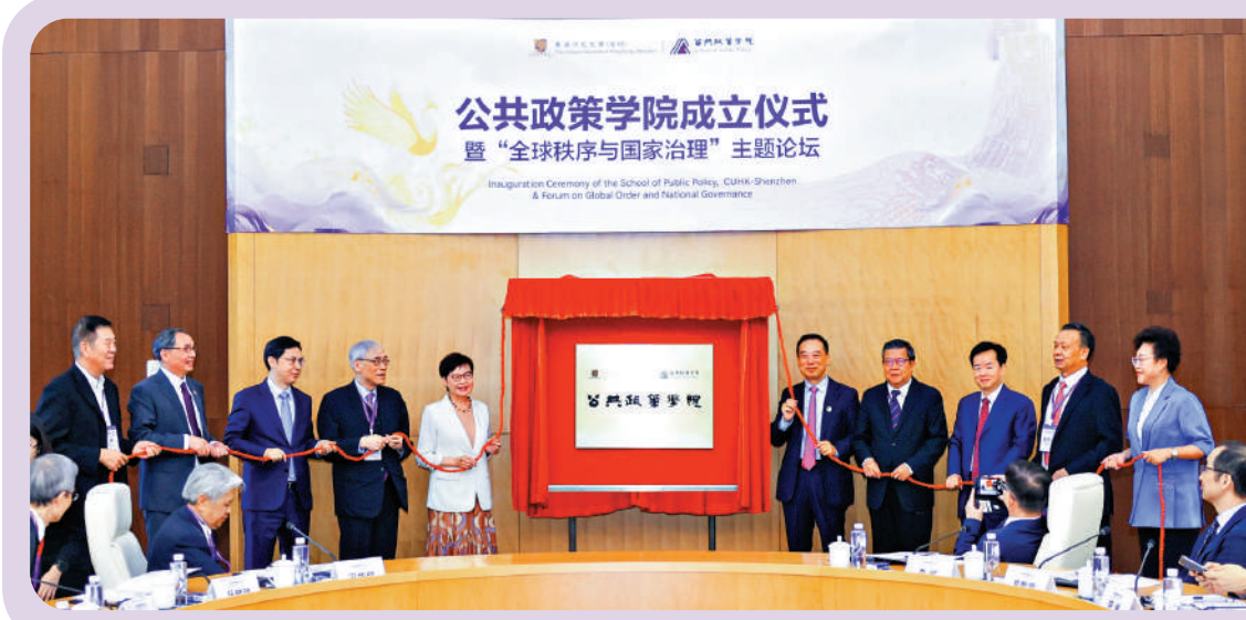
▲香港中文大學（深圳）公共政策學院揭牌成立。

「百年未有之大變局」的時代，作為國家重大發展戰略，粵港澳大灣區建設進入全面實施階段，這要求大灣區擁有更高水平、更高標準、更國際化，並且與實踐緊密結合的公共政策與人才培養機制和平台。圍繞粵港澳大灣區，學院將通過針對本地區現實問題的政策研究，為粵港澳大灣區社會經濟可持續發展培養現代公共政策研究人才。