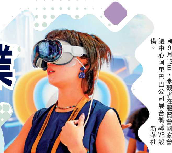
▲9月13日，參觀者在服貿會國家會議中心綜合展區參觀展出的人工智能骨科手術機器人。

2024年服貿會「北京日」暨京津冀協同招商推介大會13日舉行，京津冀集中發布新一批招商引資合作重點項目202個，投資總額1622億元（人民幣，下同），24項合作成功簽約。北京亦莊綜合保稅區在會議現場宣布獲國務院批覆同意設立，這是全國首個以發展新質生產力為主題的綜保區，將以先進製造業為底色，以先進製造業和高端服務業融合發展為基礎，以產業創新和科技創新為特色，北京市綜保區數量將達到4家。