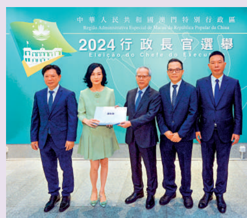
▲澳門新一任行政長官選舉將於十月十三日舉行。圖為岑浩輝（右三）早前遞交提名表的情形。

今年62歲的岑浩輝於1999年12月20日獲澳門特區終審法院院長。今年8月28日，他正式宣布參與澳門特區行政長官選舉。岑浩輝本周二（10日）提交有383名選委的聯署提名，其後再補添3人提名，即合共取得386名選委聯合提名。