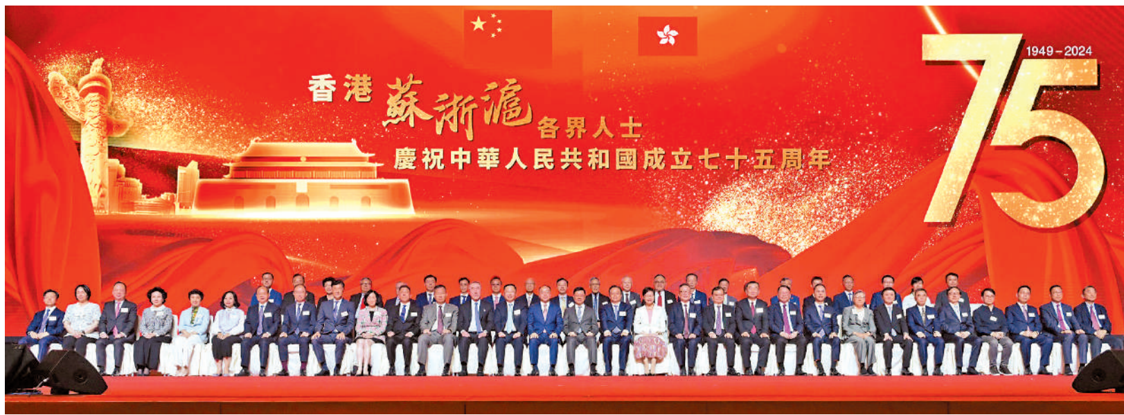
▲行政長官李家超昨日出席香港蘇浙滬各界人士慶祝中華人民共和國成立七十五周年晚宴，並與一眾嘉賓合照。

【大公報訊】記者龔學鳴報道：行政長官李家超昨日出席香港蘇浙滬各界人士慶祝中華人民共和國成立75周年晚宴。李家超致辭表示，本屆特區政府上任兩年多以來，香港已分別與江蘇、浙江和上海三地簽署了多份合作協議，涵蓋經貿投資、物流運輸、科技創新、人文交流等不同方面。香港與蘇浙滬都共同希望進一步加強合作，達到優勢互補、互利共贏。