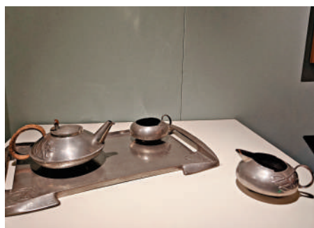
▲包括茶壺、糖碗、奶油壺、托盤的杜德里克茶具。

「指間栩栩」——威廉·莫里斯帶領下的英國工藝美術運動正在廣東省博物館展出。展覽分為「靈感覺醒」「社會美育與自由」「美的維度」三個單元，向觀眾講述在工業文明飛速發展的十九世紀下半葉，由「現代設計之父」威廉·莫里斯倡導發起的工藝美術運動，展示來自英國維多利亞與艾爾伯特博物館收藏的包括威廉·莫里斯、查爾斯·沃塞、查爾斯·羅伯特·阿什比、威廉·德·摩根等多位工藝美術運動代表人物以及各工藝美術行會的過百件圖案設計、紡織品、書籍、珠寶、傢具、家居用品等設計傑作。百年前英國設計師及工匠用雙手把世間美好留在了這些作品之中，留在了人們的生活裏，讓今天的觀眾從中感受獨具匠心之美。