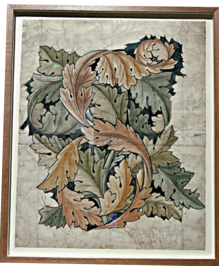
▲《莨苳》壁紙樣本。