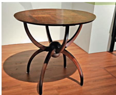
▲查爾斯·沃塞設計的桌子。