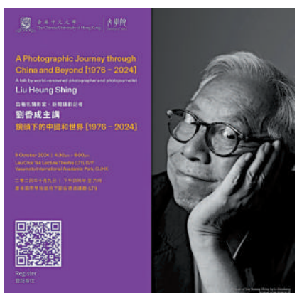
▲10月9日，攝影師劉香成將於香港中文大學舉行公開講座。

【大公報訊】10月9日，攝影師劉香成將於香港中文大學舉行公開講座「鏡頭下的中國和世界（1976-2024）」。