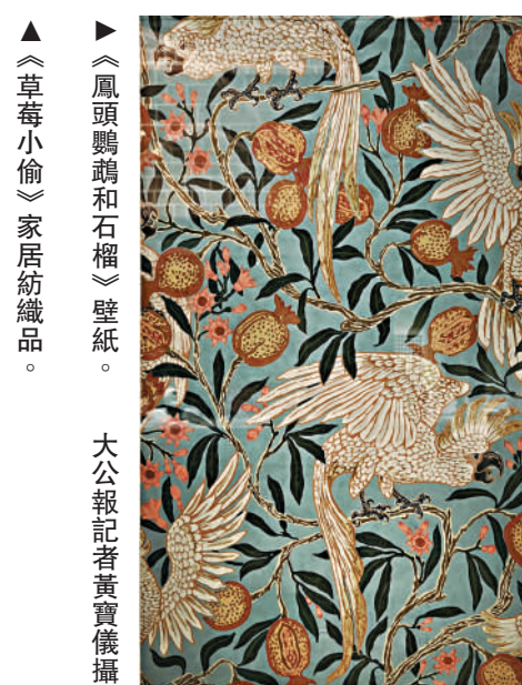
▲《鳳頭鸚鵡和石榴》壁紙。 ▲《草莓小偷》家居紡織品。