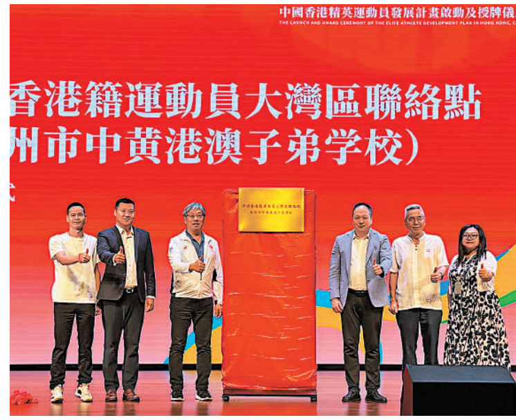
▲廣州市中黃港澳子弟學校獲授牌。

記者了解到，中國香港現代五項總會廣東訓練基地將為內地港生提供專業的訓練平台，學校現代五項培養計劃將針對劍擊、游泳、馬術、射擊和跑步5個項目進行專業的訓練，帶領學生參加廣東省內賽事、全國賽事乃至國際賽事。學生通過科學系統的訓練，能夠得到港協的認可，並有機會註冊成為香港運動員，最終朝着成為香港的精英運動員發展。