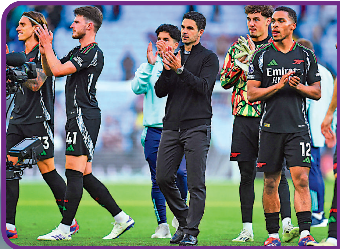
▲阿仙奴領隊阿迪達(右三)。