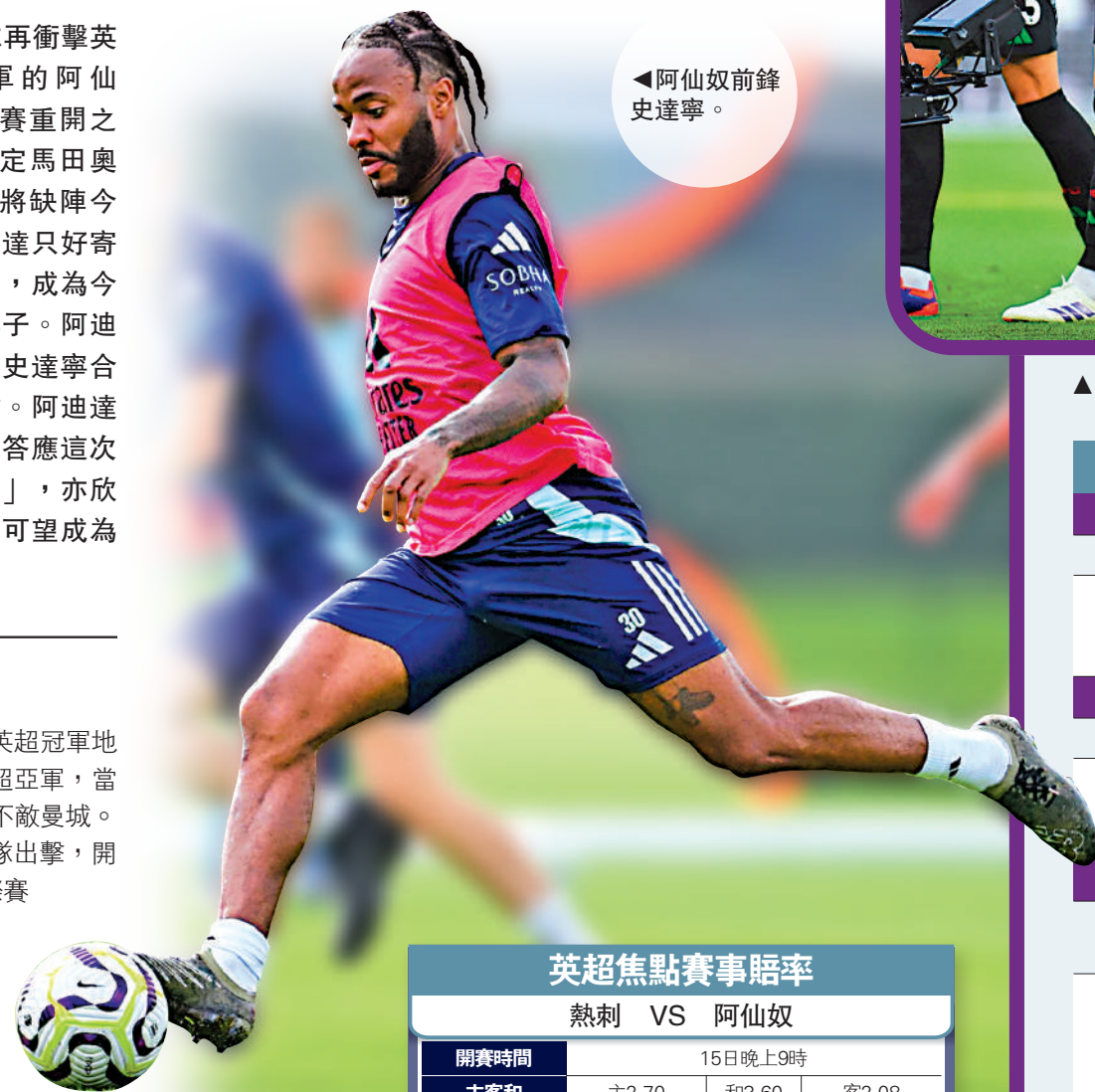
▲阿仙奴前鋒史達寧。