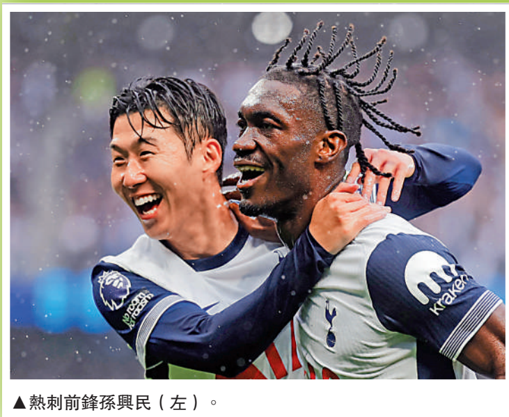
▲熱刺前鋒孫興民(左)。