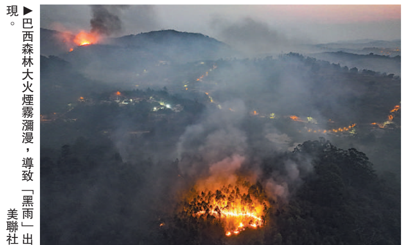
巴西森林大火煙霧瀰漫，導致「黑雨」出現。