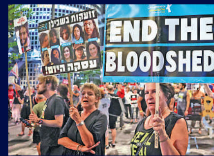
以色列民眾在以色列國防部前示威，要求停戰。