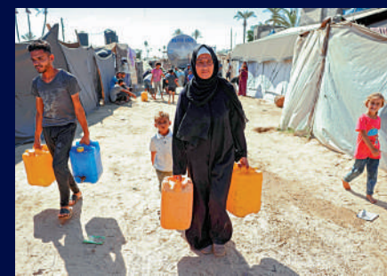
流離失所的加沙民眾14日用塑料容器取水。