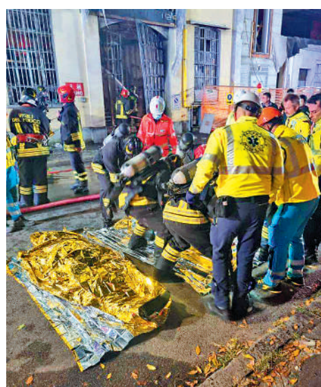
意大利米蘭商店火災，三名中國公民遇難。

【大公報訊】據新華社、意大利《日報》報導：意大利米蘭市一家商舖12日發生火災，導致3名中國人死亡，受害者包括1名24歲男子，以及一對分別為18歲、17歲的姐弟。