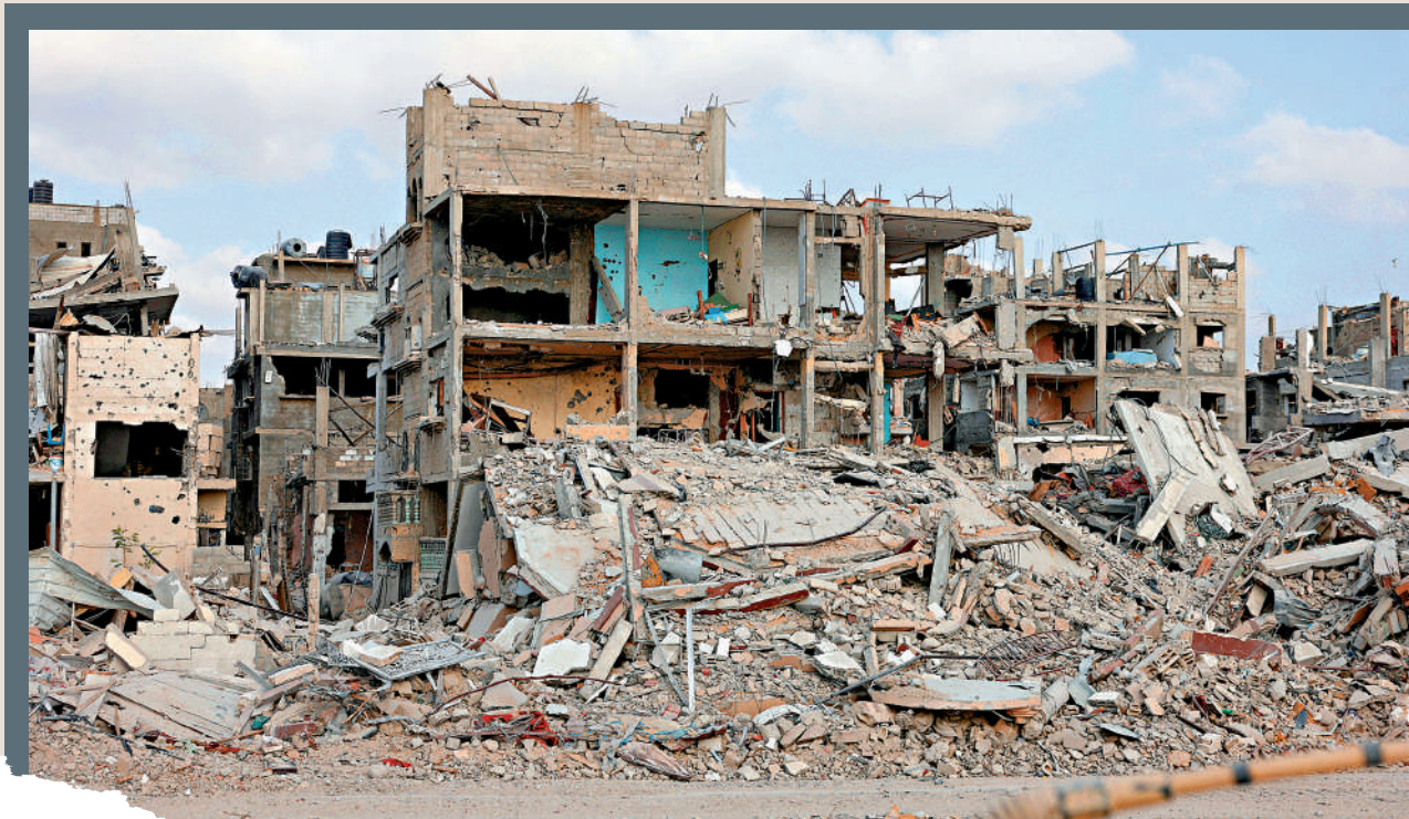
以重襲擊加沙地帶，當地住宅變廢墟。

自從去年10月新一輪巴以衝突爆發以來，戰火讓巴勒斯坦遭遇嚴重的經濟破壞。根據聯合國機構發布的最新報告，加沙地帶的國內生產總值（GDP）暴跌81%，經濟規模已萎縮至不到戰前的六分之一，該地區崗位減少了20萬個，而約旦河西岸地區的失業率則幾乎增加了兩倍。外界預計恢復加沙經濟至戰前水平需要數十年。