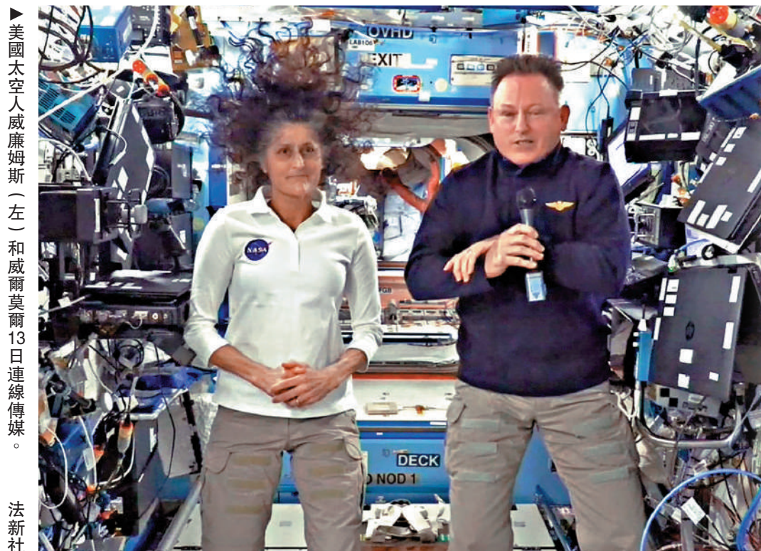
美國太空人威廉姆斯(左)和威爾莫爾13日連線傳媒。