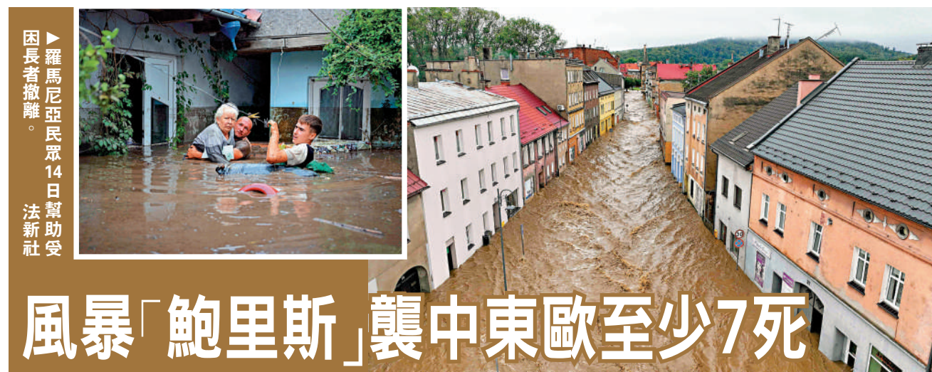
羅馬尼亞民眾14日幫助受困長者撤離。