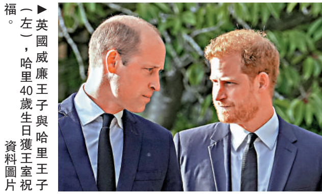
英國威廉王子與哈里王子(左)，哈里40歲生日獲王室祝賀。資料圖片

哈里王子則於生日當天與妻子和孩子們在加州舉行私人慶祝活動，之後將與朋友們一起出遊度假。