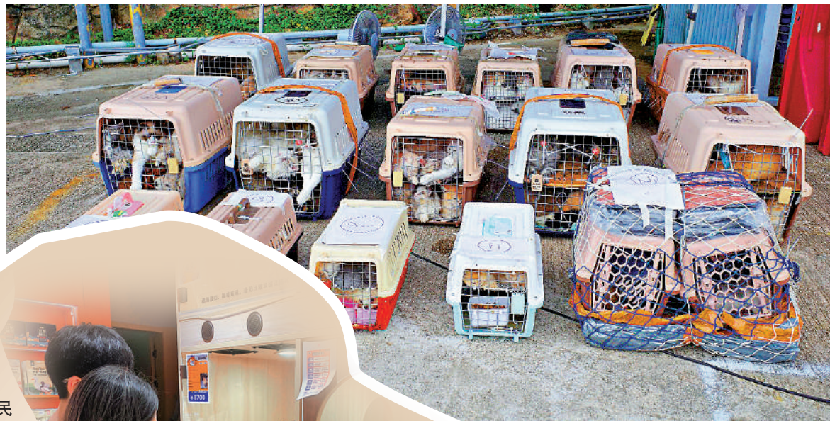
▲近年愛協接獲不少執法機關行動中檢獲的走私貓狗。