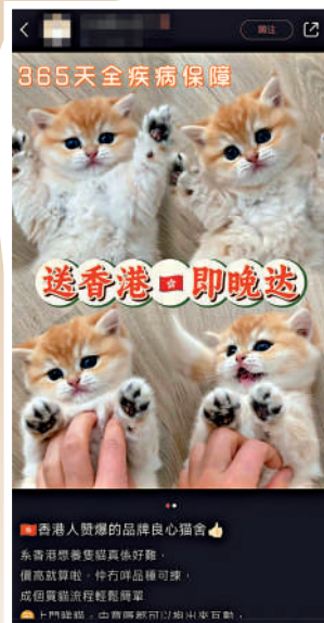
▲內地平台小紅書上有提供寵物即日直送香港服務，其合法性存疑。