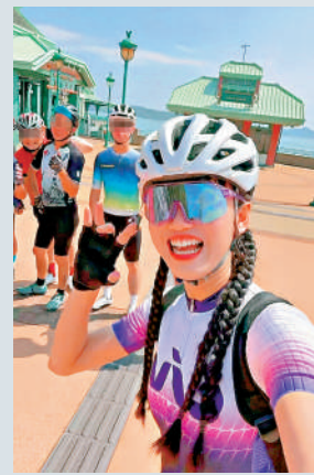
▲女事主昨早與多名單車友於香港迪士尼附近集合並打卡，詎料數小時後便發生意外。

事發後，大批網民湧入留言區悼念，有熟悉香港路況的網民表示，大嶼山一帶不適宜踩單車，大巴穿梭，相當危險。有網民則建議：「在抖音發過去大嶼山騎行經歷的騎友，應該把視頻刪了，不要再誤導騎行新手去那裏騎車了，真的好危險。」