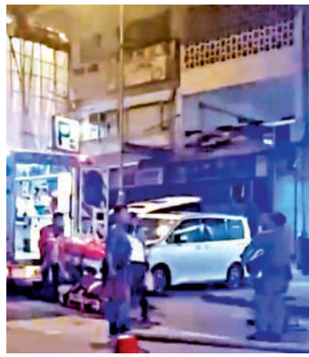
▼警員圍封現場調查。