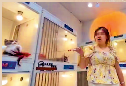
▲羅湖區內一間寵物店店主表示，寵物最快購買半小時後便可送抵香港。