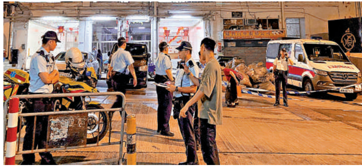
▲傷者由救護車送往醫院治理。