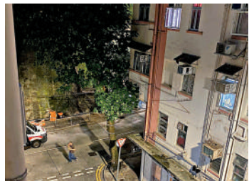
▲北角錦屏街錦屏樓昨晚發生家暴襲擊案，圖為案發現場。