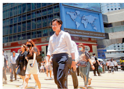
新資本投資者入境計劃申請反應熱烈。