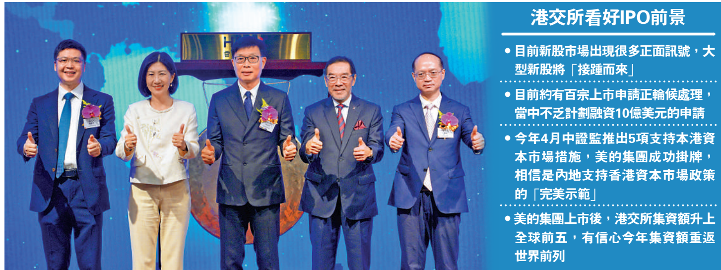
▲美的集團昨日成功在港交所掛牌。港交所行政總裁陳翊庭(左二)出席上市儀式後預告，大型新股接踵而來。