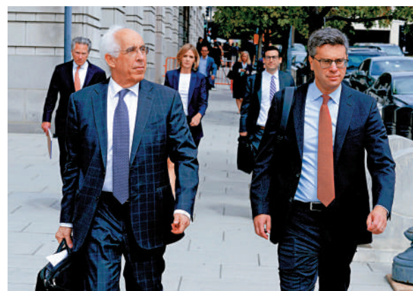
▲代表TikTok的律師團隊16日離開法院。

美國哥倫比亞特區聯邦巡迴上訴法院的3位法官16日聽取TikTok訴美國司法部長加蘭案中雙方代表律師陳詞。此案源於美國總統拜登4月簽署的一項法案。該法案以「國家安全」為由，要求字節跳動必須在明年1月19日前出售或剝離TikTok在美資產，否則將