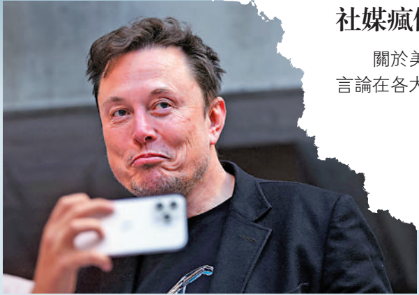
▲馬斯克在社媒發表爭議言論，受到白宮譴責。