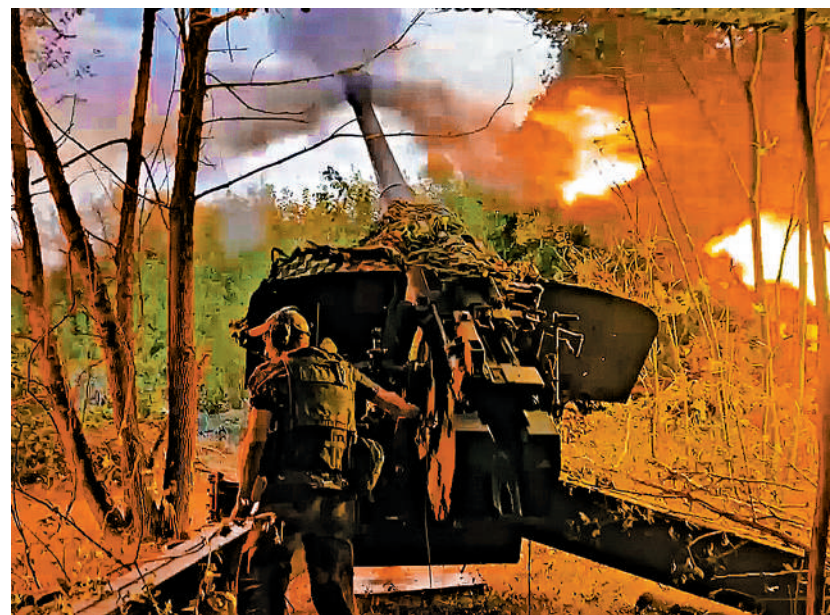
▲俄羅斯國防部13日公布俄軍在庫爾斯克地區向烏軍開火的畫面。