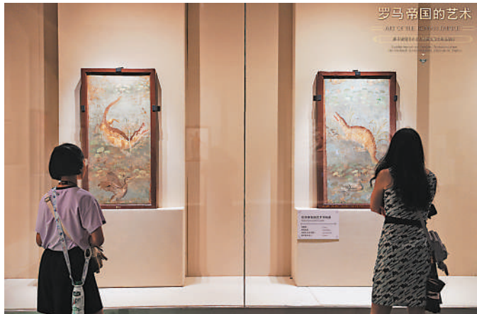
▲展廳一隅。廣東省博物館