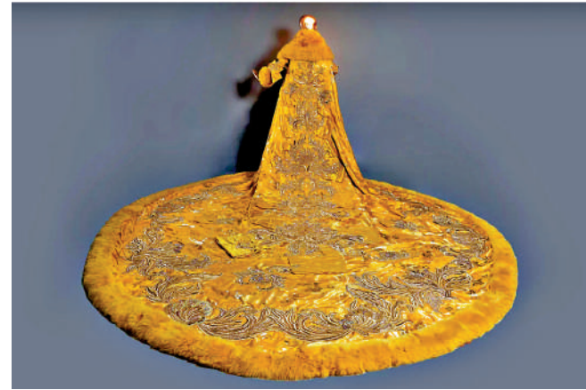
▲《黃皇后》《一千零一夜》系列，2009年。

「東方新說」展示郭培以東方民間故事為靈感和主題而創作的發布會系列作品，並以當代視角探索古代文化與圖騰的相輔相成。《一千零一夜》（2009）系列作品取材自文學故事《一千零一夜》。郭培在2009年創作的作品《黃皇后》重達25公斤、袍長4米，凸顯出女性的自信與力量；此作品曾由美國流行音樂天后Rihanna在2015年紐約大都會藝術博