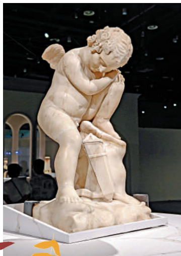
▲沉睡中的丘比特。