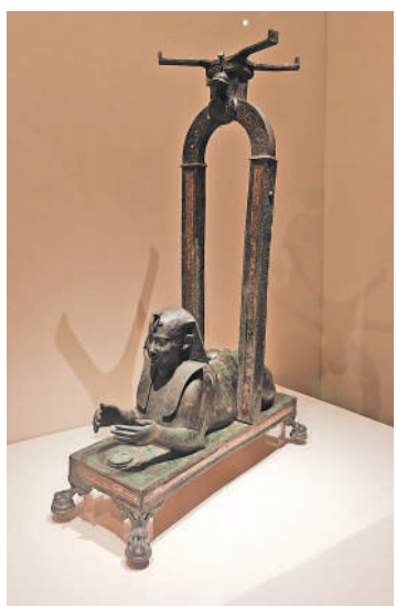
▲斯芬克斯像青銅桌腳。

宴會不僅僅有美食美酒，音樂會、舞蹈表演以及猜謎遊戲等活動也會輪番上陣，因此不少宴會就在寬闊的花園舉行，這也是本次展覽特設「花園宴會」投影的一個重要原因。噴泉是羅馬花園中最具藝術特色的裝飾，在羅馬帝國時期，花園噴泉不僅是裝飾，更重要的是作為具有實際功能的飲用水來源和引水裝置的終端。噴泉雕塑裝飾物就是在這一功能下，為了美化這個出水終端而設計的。本次展覽中就有一件赫庫蘭尼姆遺址出土的西勒諾斯青銅像噴泉裝飾，作為酒神的好友與導師，希臘神話中的山林之神——西勒諾斯同樣嗜酒如命。雕像中他騎在身下的囊袋，推測為古希臘羅馬常見的山羊皮袋酒囊。