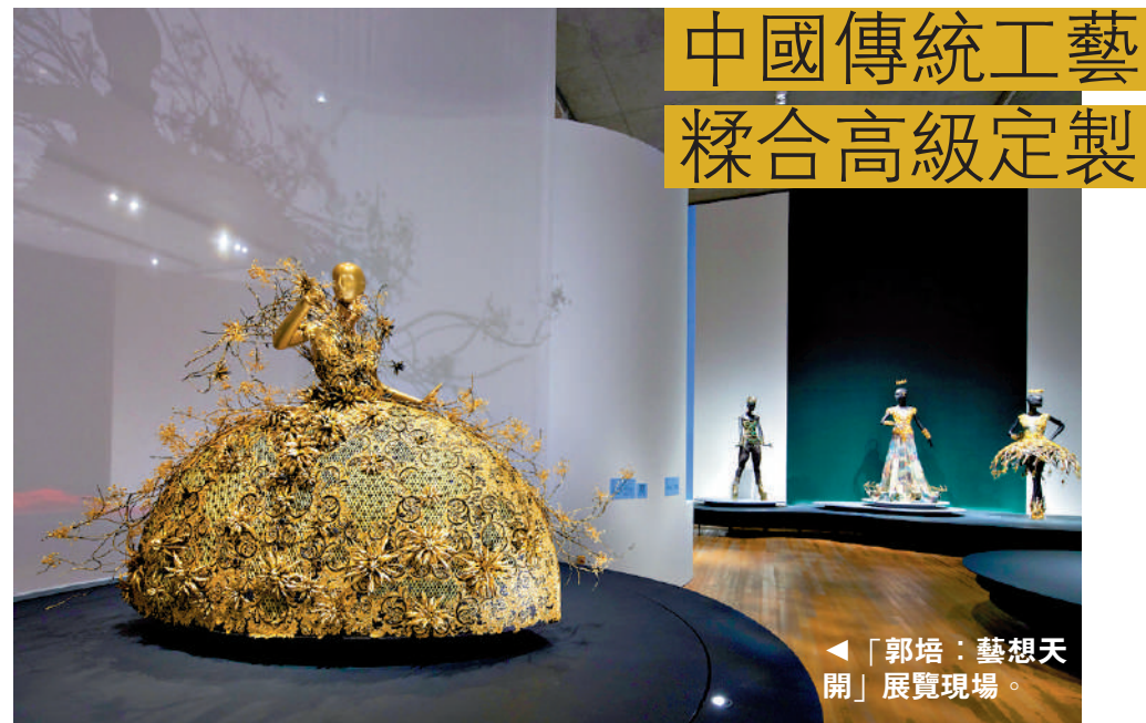
▲「郭培：藝想天開」展覽現場。

「夢與現實」展示郭培對時間和重生的思考與作品表達。《輪迴》（2006）發布會系列通過晝夜更替、生命輪迴的主題，嘗試探索與描繪自然循環和生生不息的生命力。源自此系列的展品中包括郭培的首件高級定製作品《大金》（2006）。而在《遇見》（2016）發布會系列中，郭培則以非傳統面料和對比強烈的色彩組合為設計語言。